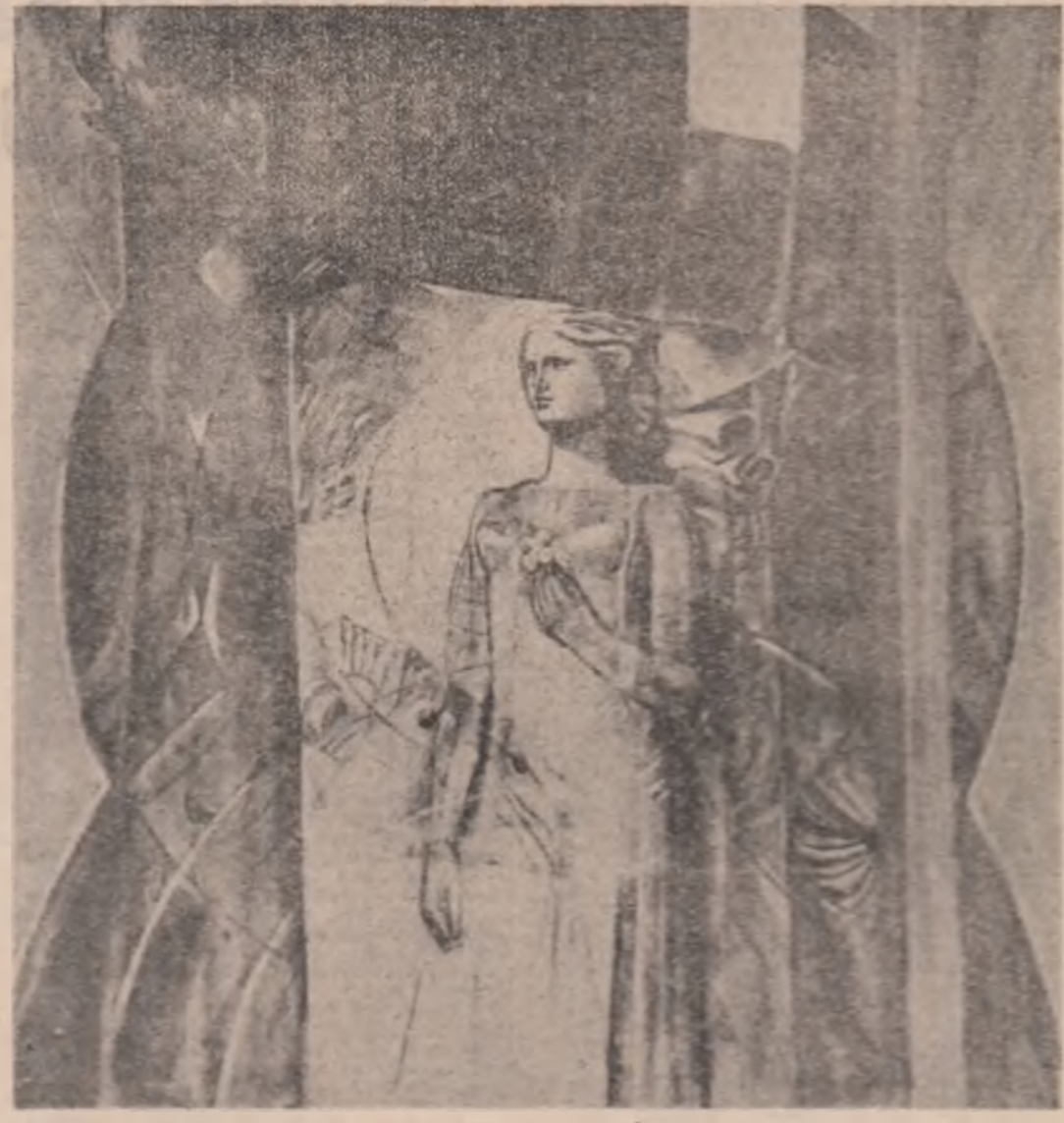
Geta Mermese: „Sărbătoare”

STELELE LUPENILOR NU SE STING O fascinație mai îndepărtată au fost pentru minerii Lupenilui ilustratele îngerbente,