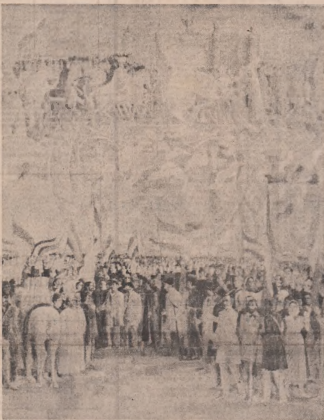
Vasile Pop Negrețean: „1918”