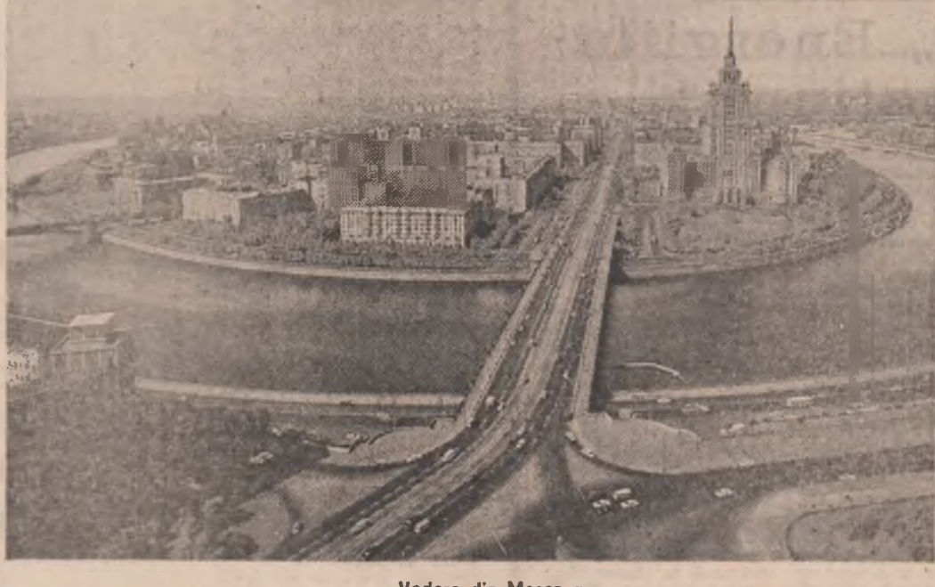
Vedere din Moscova