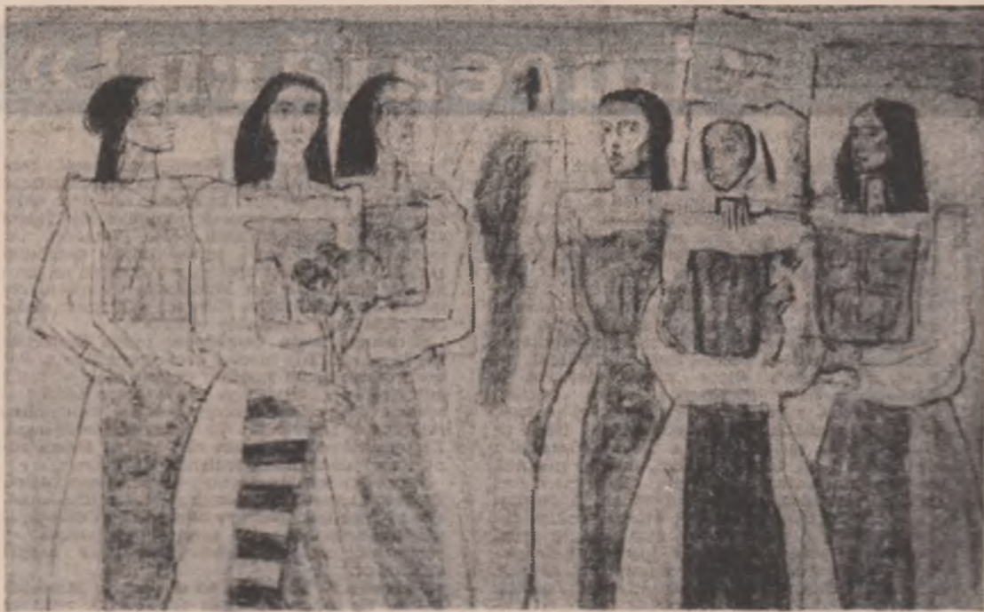
Tablou de Sergiu Rugină

Furia păcii cu daltă cioplind în extaz și sub daltă tot mai vie țipind floarea capului. Alături, vacamul prunilor daltă la taci pe virfuri de nerăbdarea albinelor, de zimții aripii lor. Vino, iubito, vino în templu acesta neomeneste schingiuit de liniște din nosul razelor noi. Vino, vino prin ziduri vino prin zălele legilor vino prin stinci ca izvorul și lasă tunelul deschis ca și el. Vino, pământul și-acum se roagă-n genunchii ce o mamă să-ți dele norocul toți caii.