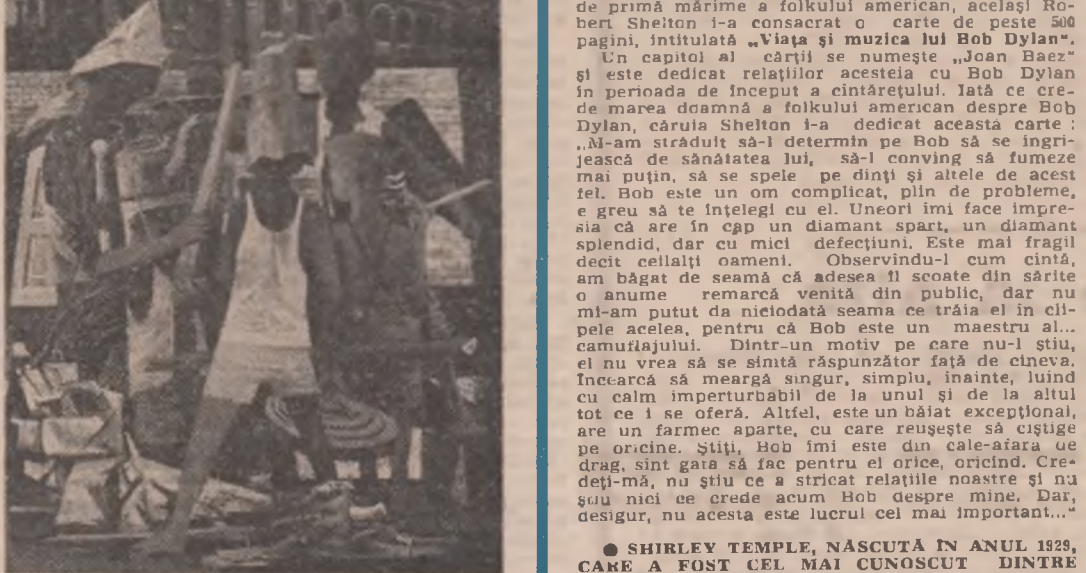
Philip Guston: „Mortual Memory”, 1941 — ulei pe pînză. Col. Muzeului de Artă, St. Louis, Missouri