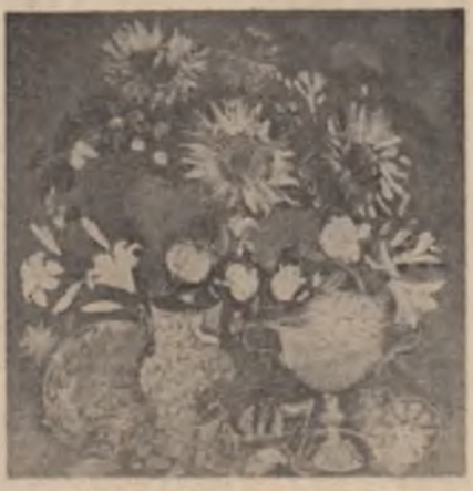
Iacob Lazăr : „Floarea soarelui”