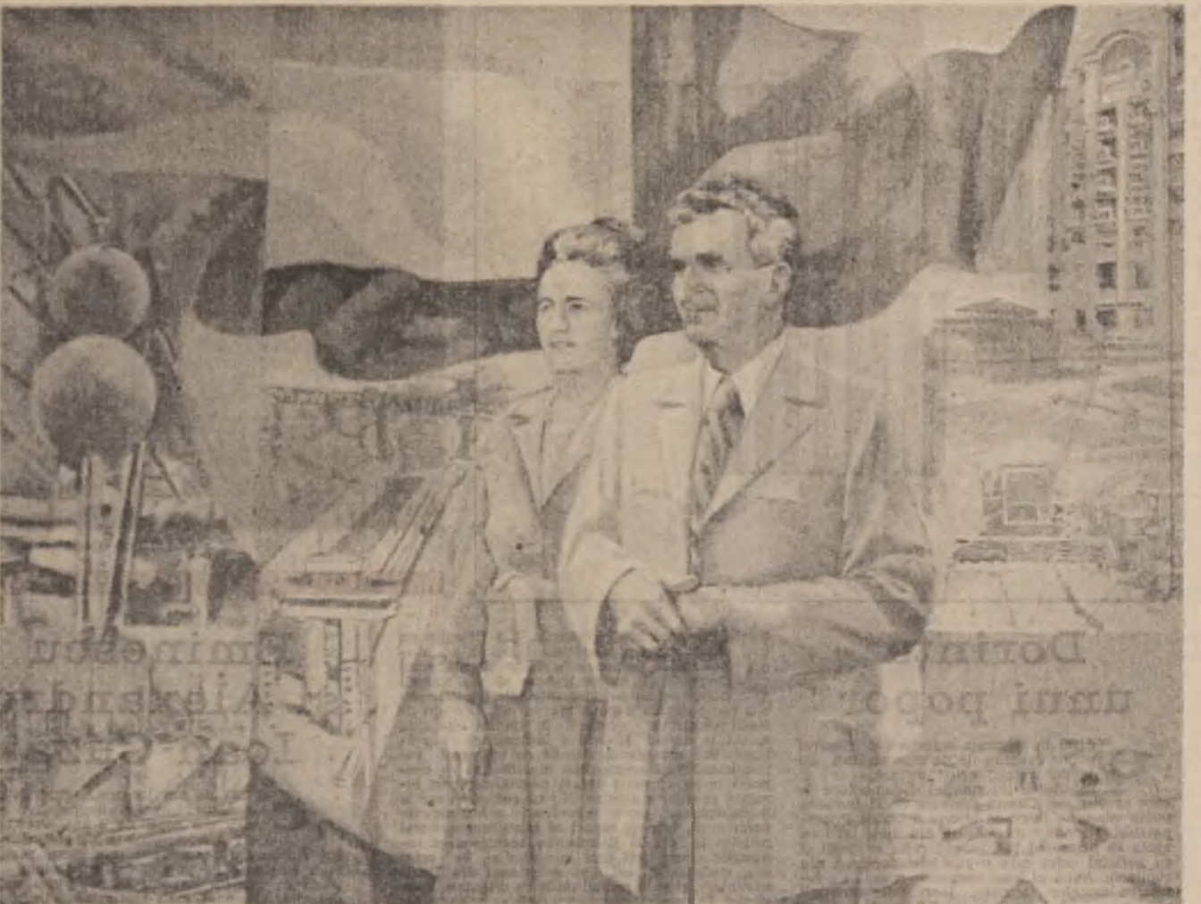
„Vremuri de glorie” — tablou de Gheorghe Ionită

Prin inimi de eroi Prin inimi de eroi ne trece țara, Cum o trecut prin milenarii timp. Ni-i vîrsta tuturora primăvara, Lubrarea noastră-i unic onetimp.