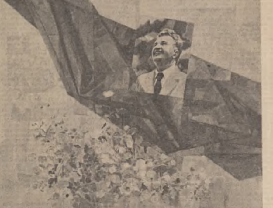
Tabloul de Etlmie Modică