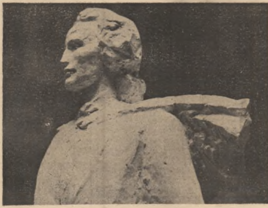
„Eminescu” — sculptură de Gabriela Manola Adoc

Luceafărul Într-o asemenea vastă și luminoasă perspectivă, țara își scrie cronică muncii și vieții sale, adăugând la miza sa de valori economice, culturale și sociale noi și noi înfăptuiri, făcând din opera edificării și înalțării sale în timp o operă vastă, eroică și înălțătoare, demnă de cele mai înalte succese ale gândirii și acțiunii umane. Geniul creator al poporului are în fruntea sa pe cititorul genial al epocii marelui pe care o trăim și această vreme pe care o trăim și această vreme a dintre garanțiile de astăzi și actuale, este una din garanțiile supreme ale necontenitei noastre înaintări spre viitor.