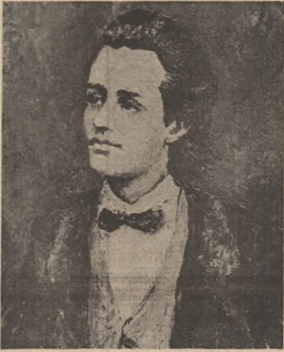
„EMINESCU”, tablou de Alexandrina Stănescu