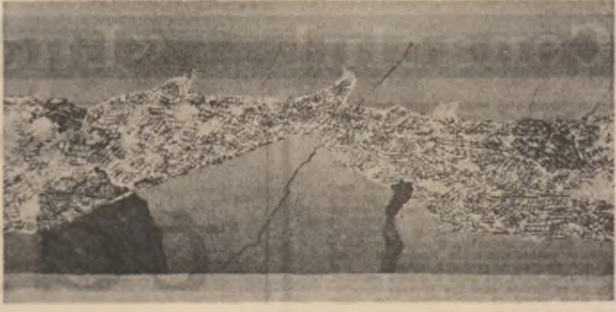
Grafică de Nicolae Florea

Ca un munte de pietate se-nvîrte cerul înaintea ta. Nu-i vezi marginile, decit țirziu, cînd constința ta s-a depărtat de tine și te privește ca pe-o pasăre moartă. Așa se înalță mereu piramida albastrului oscătîndu-se ca un zbor în care toate stelele au fost treste în ieapă pină la ultima.