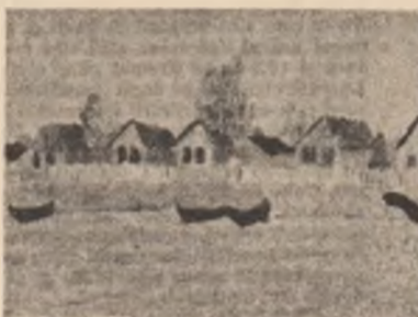
Umbră miinii renaște darința miraculoaselor urme