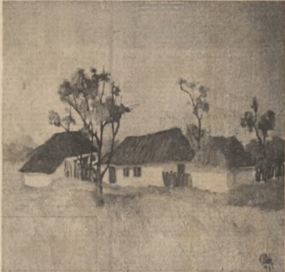
Tableu de Constantin Piliuță (p. 1-7)