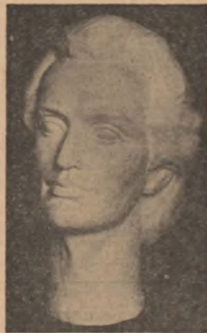
„EMINESCU” de Nina Iliu

Poema ca Luceafărul, comparabil în literatura secolului trecut numai cu Hyperion al lui Hölderlin, Călin, admirabilă decantație a unui univers și unui peisaj tipic românesc. Săra pe deal cu perfecțiunea versurilor ei egală poate numai de desăvârșirea aceluia Idilice ale lui Leopardi. Serenările, poeme de larg zbor în care idealurile poetului român își găsesc cea mai înaltă expresie, fac din opera lui Eminescu cel mai complet și mai paradigmatic capitol al literaturii române. Acum douăzeci de ani, consacram lui Eminescu un capitol al cărții mele Nemesis și libertatea, apărută la Madrid. Scriam atunci: „creșta poetică a lui Eminescu este umilitor de vastă, întind seama de acurta lui viață și de încă mai acurta perioadă de fecunditate. Ea este rodul unui geniu care simbolizează o maximă concentrare creatoare, dar căruia nu îi este străină nici o neobișnută cultură”. Profundește lui cunoștința merg de la Horatius și clasicii pe care îi citea în original, din