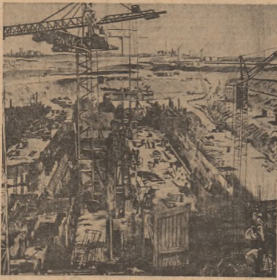
Ion Bălan: „Șantier”