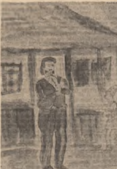
„Jvan Turbincă” — ilustrație de Liviu Siminiceanu, cl. a VII-a D, Școala generală nr. 12