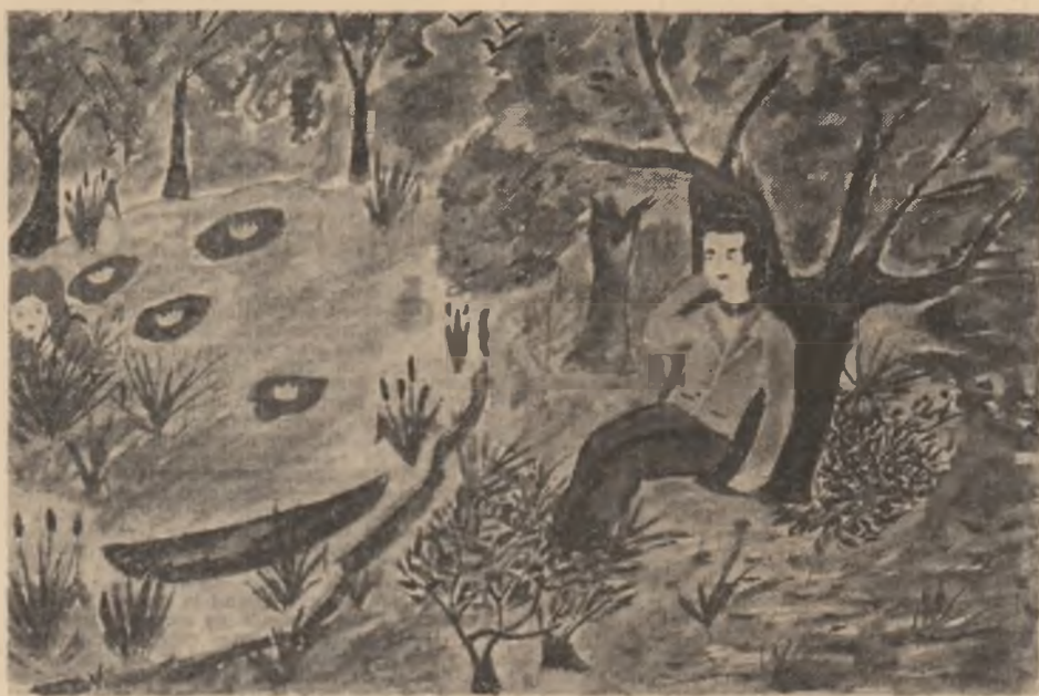
„Lacul” — ilustrație de Radu Serin, cl. a V-a G, Școala generală nr. 12