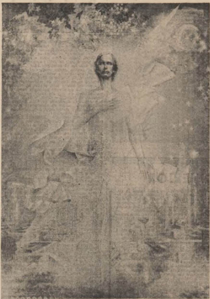
„Eminescu” — tablou de Vasile Pop Negrețean