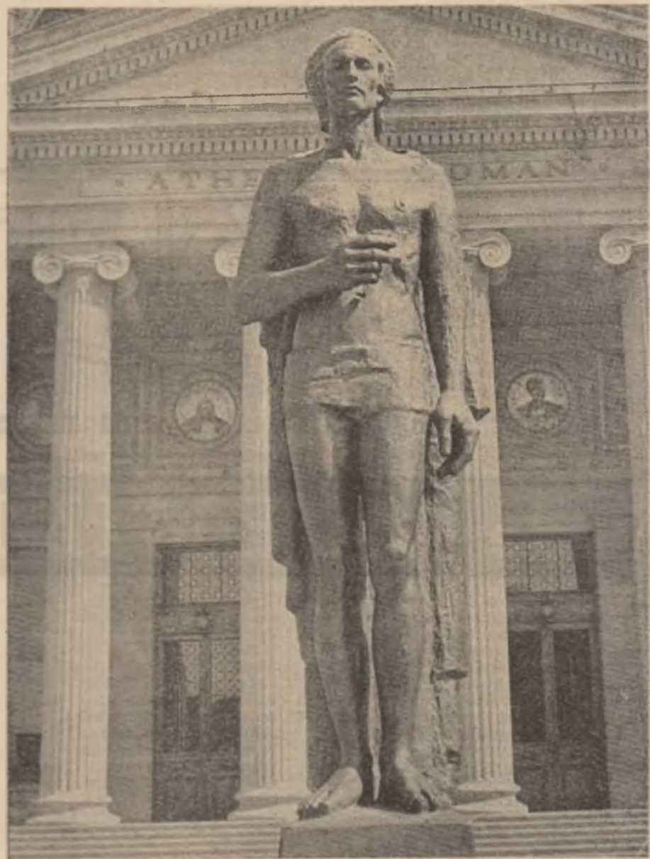
Sculptură de Gheorghe Anghel

1) G. Călinescu: „Istoria literaturii române”, p. 458. 2) Cf. G. Călinescu: „M. Eminescu. Studii și articole”, Iași, Ed. Junimea, 1978, p. 53-56. 3) „Opere”, XIII, p. 58. 4) Ibidem, p. 57. 5) P. Pandrea: „Portrete și controverse”, p. 116. 6) Ibidem. 7) „Opere”, XIII, p. 81. 8) „Opere”, XIII, p. 83. 9) Ibidem.