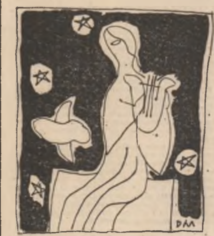
Grafică de Dragoș Marărescu