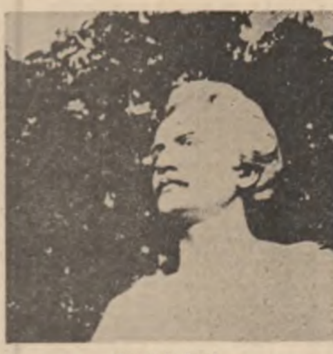
Bust de Fr. Storc