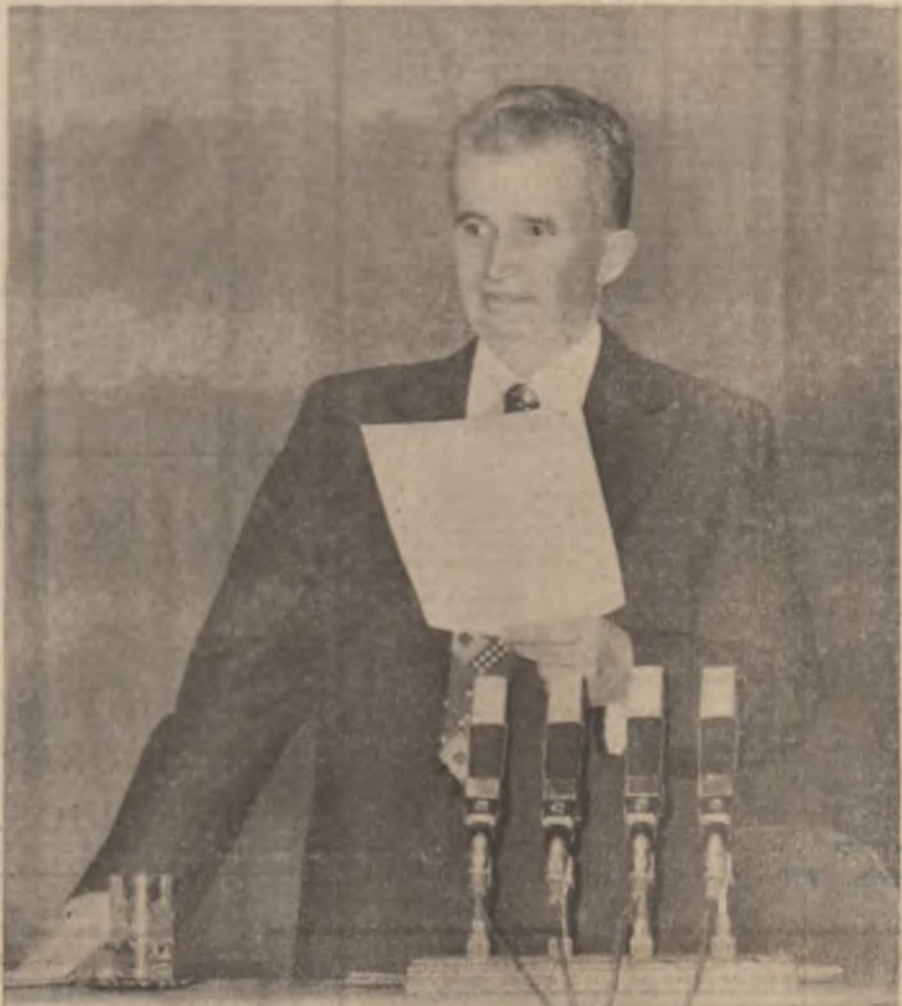
Suh președinția tovarășului Nicolae Ceaușescu a avut loc Plenara Consiliului Național al Oamenilor Muncii, moment semnificativ pentru climatul general în care documente de importanță cardinală — Programul-Directivă și Tezele pentru cel de al XIV-lea Congres — se află în dezbaterea întregului partid, a întregului popor. Cuvîntarea pe care secretarul general al partidului a rostit-o în încheierea lucrărilor acestui reprezentativ forum al democrației noastre muncitorești-revoluționare abordează o inimă arde de problemă referitoare la actualitatea politică, economică și socială, la situația internațională. În consens cu întreaga națiune, participanții și-au exprimat adevăratea fierbinte față de Hotărîrea Plenară C.C. al P.C.R. privind propunerea de realizare a tovarășului Nicolae Ceaușescu, la cel de al XIV-lea Congres, în funcția supremă de secretar general al partidului.

e xistă în literatura română o poezie a apei, prin excelență tradițională, ce se întrezărește tot mai des la poezii promovate '70 (ai „generației de reflux”, cum am denumit-o), între care trebuie să menționăm și Sabina Opreanu, autorea unor veritabile Poeme de Riu (Editura Eminescu, 1987), evident, după O privire asupra Rîului (mai veche „ochire”, certificată „editorial” la Cartea Românească, în 1982; dar despre „o obsesie hidrografică” în perimetrul filosofiei nu poate fi vorba la acest poet nici în celelalte volume — Smetul răzeșii — 1977, Amurg experimental — 1983, etc.). „Poemele de Riu”, spre a reverbera o singură dată cosmică, paradisiacă rarori, au o respiratie larg-învaluitoare, cum a rîului de platou, limpidă, nu hidrografic-balaurească, așa cum s-ar fi așteptat „recentului” amator și de elemente „biografice”, stînd rîul Diernei / Cernei negru-învolburat la poalele Muntelui cu Băl Herculane, unde s-a intrat poetul, desigur, într-o nebănuită lumină ale Cuvîntului / Logosului: pe registru poetic — iar pe alocuri, și pe cel „motivic” — rîul de foc al cuvintelor din „poemele de riu” intră parca în rezonanță cu Oceanul Zăpezilor lui Saint-John Perse, ceea ce ține și de un anume rafinament paradoxist, dimensionat în poezia refluxgenerației. Din crezul poetului