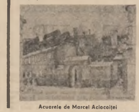
Acuarele de Marcel Alciocăi

Din miza rece a oceanului, pe lîm, se naşte tăpila Cu solzi verzi, cu guşă aurie, de mii de ani Stă pe pietre la soare