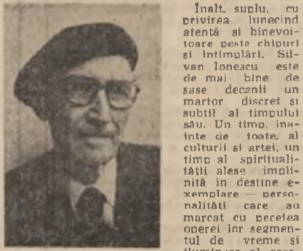
tuil melez de lume.