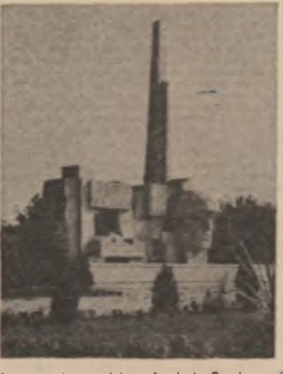
Monumentul ostașului român de la Căsei, operă a sculptorului Vida Geza