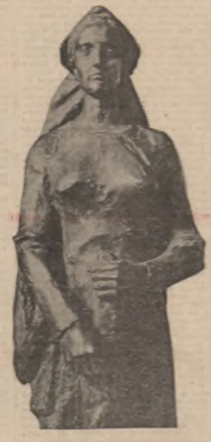
„Victoria” - sculptura de Gheorghe Asghar