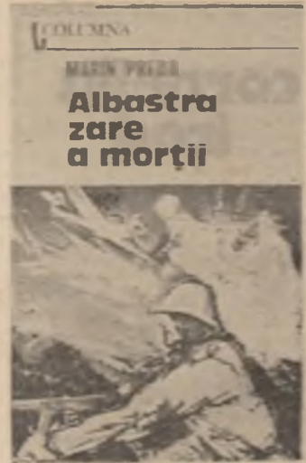
Albastru zăre a morții