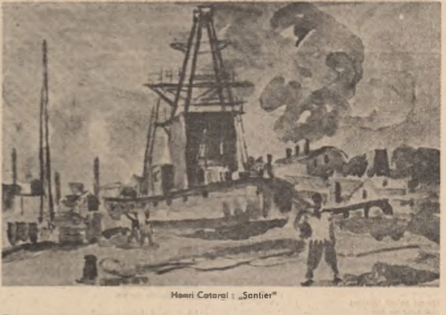
Henri Cotariu / „Șantier”