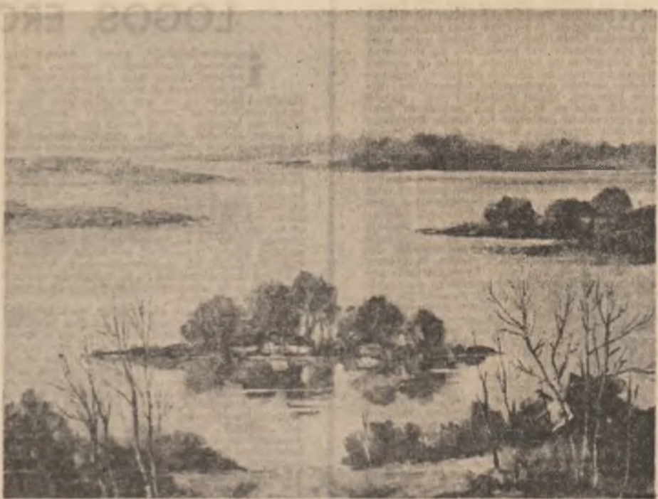
Tablouri de Bogdan Săbi, din expoziția deschisă la „Căminul artei (pag. 4-8)

nu doar vinul te păstra aici printre linguri și păsări din lemn.