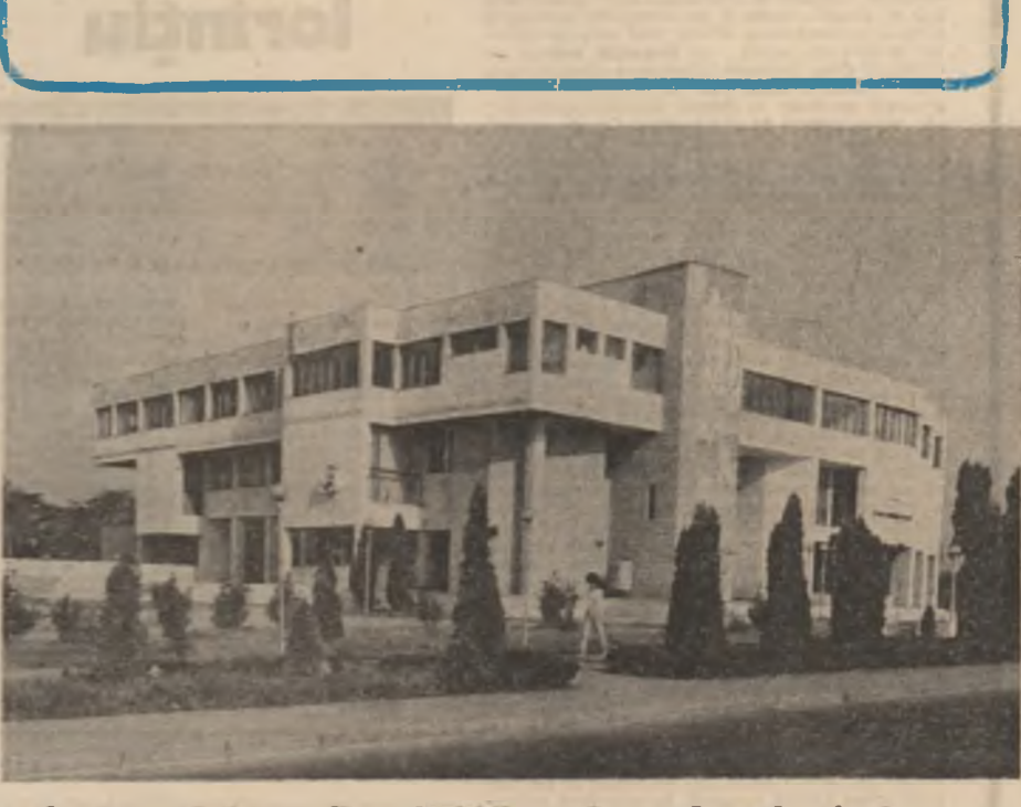
Centrul de creație și cultură „Căminul Românesc” pentru tineret din Drobeta Turnu Severin