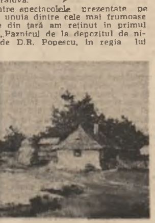
Tabloul de Romeo Cosmovic

Oricum și din orice orizont am examina-o, sărbătorea acestei decăde teatrale a fost recitalul „Arta Iubirii”, o uluitoare, fascinantă performanță artistică a Valeriei Seclu. Deopotrivă cult și popular, acest regal de poezie regizat de Cătălina Burzianu pe scena Teatrului Mic este un desăvîșit spectacol intelectual, de înalt rafinament artistic; cucurior, în același timp, plină la extaz și unic deocădată în istoria artei scenice românești. Vom reveni.