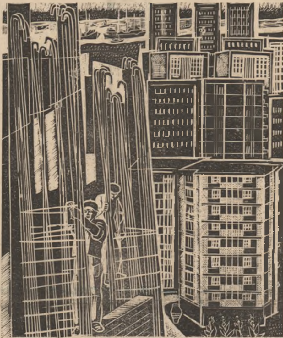
„Construcții” — grafică de Emilia Dumitrescu