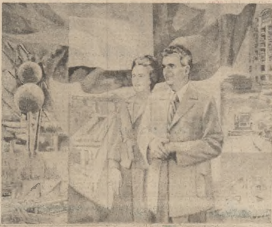
Gheorghe Ianiș: „Vremuri de glorie”

Pentru munca și viața întregii țări, hotărârile marelui forum comunist sînt asemenea unui puternic fascicul de raze care luminează în timp căi și modalități ale gândirii și faptelor înaintate, călăuzitoare spre tot mai înalte trepte de progres și civilizație. Ecourile amplor dezbateri din Congres reverberază pe planul conștiinței patriotice, revoluționare, iar acestea are o semnificație aparte în aceste zile, cînd ne gîndim la faptul că, în ziua de azi, sîmbătoare scumpă inimii poporului, ideile care sînt la baza unității naționale se regăsesc în timp sub semnul ideilor și faptelor independenței depline, economice și politice, făcîndu-se astfel un fapt deosebit de important pentru că în esența lui stă explicația propriei noastre înaintări pe calea socialismului și comunismului, a independenței și suveranității. Așa cum se subliniază în Rezoluția marelui forum, Congresul își exprimă profunda convingere că actul politic de importanță istorică al reînvestirii tovarășului Nicolae Ceaușescu în supremă funcție de secretar general al partidului reprezintă garanția cea mai sigură a continuității procesului de afirmare a socialismului și comunismului în țara noastră. Pe lângă faptul că este un fapt deosebit de important pentru că în esența lui stă explicația propriei noastre înaintări pe calea socialismului și comunismului, a independenței și suveranității.