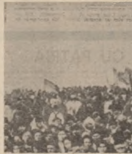
Marea adunare populară de la 1 decembrie 1918