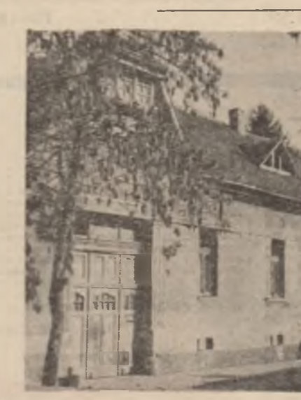
Sediul Consiliului Național Român