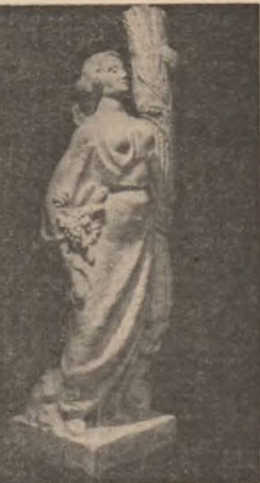
„Cimpia” — sculptură de Justin Năstase