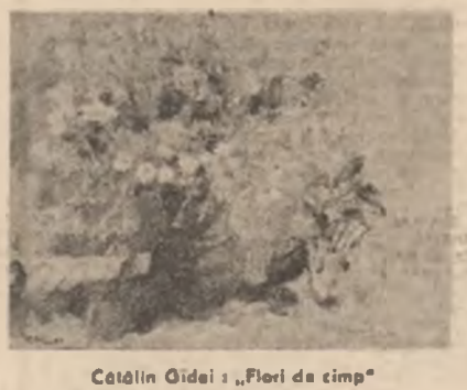
Cătălin Gidei: „Flori de cîmp”