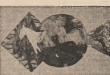
Portret și picturii în ulei pe lemn de Augustin Zborca

I deci voi muri, — și alții eu murit deci nu mi-a fost de-nvățătură, ca să-l sîruți apoi la nesfîrșit, sîrută-mi sufletul pe gură, deci voi muri, — și alții au murit deci nu mi-a fost de-nvățătură, ca să-l sîruți apoi la nesfîrșit, sîrută-mi sufletul pe gură!