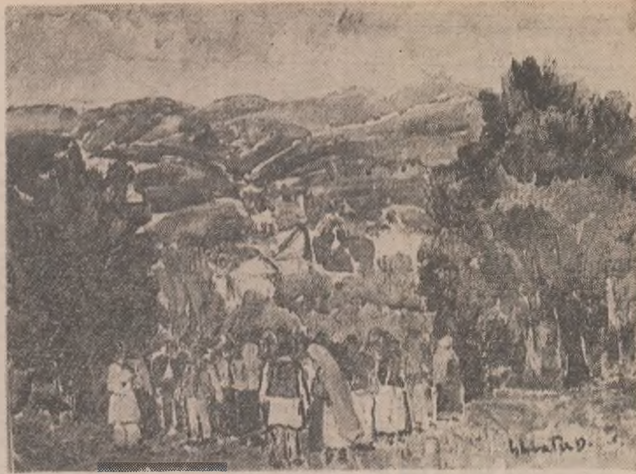
IN PAGINILE REVISTEI REPRODUCERI DUPĂ TABLOURI DE DIMITRIE GHIAȚĂ