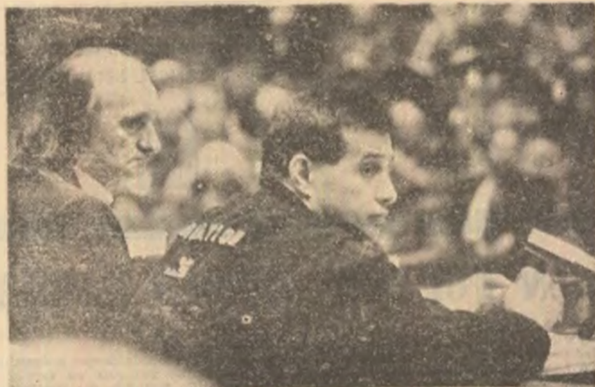
Un team redutabil la conducerea Uniunii Scriitorilor : Ștefan Bănuțescu și Mircea Dinescu