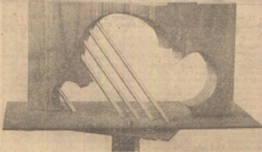
Al. Arghira Călinescu