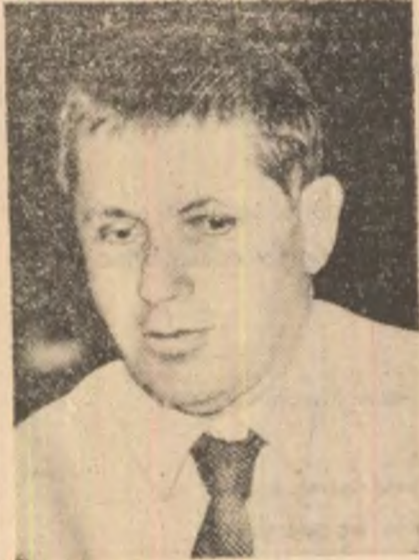
Gheorghe Grigurecu pe un Teritoriu liric