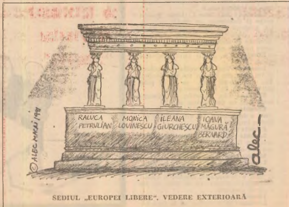
SEDIUL „EUROPEI LIBERE”. VEDERE EXTERIOARĂ

Se mai dă o raită prin cîteva birouri cabine de transmisie, în timp ce căpitanul proferează vorbe grele.