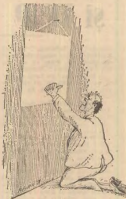
NICOLAE MANOLESCU — Director „România literară”

totul a fost magistral, în trei, ca în iad. Așadar, a venit la această aniversare numai lume bună, s-a iscat o imbulzeală de-ți puteai scoate ochii cu degetele, că pină și Stere Gulea, realizatorul filmului „Piața Universității”, fascinat de acest mediu și de victățiile ce-l populează, a promis să realizeze o altă peliculă. „Piața în subsol” sau „Viața în subsol” — numele nu contează, deocamdată! — pentru a rămâne pe primul loc la vînzări. Purtătorul de vorbe al băieților, criticul Nicolae Ulteru, și purtătoarea de mesaje a lui Radu Ceonța, Carolina Ilica, au cronicile deja pregătite. Acestea vor fi publicate înainte de premieră, în prezența premierului în mai multe ziare deodată, pentru ca succesul să fie asigurat ab initio, iar concordia națională să fie asigurată la A.D.A.S. În final, s-au scandat lozinci anti-aeriene, antidiluviene și anticamerale, adică „Jos ala!”, „Jos celălalt!”, „Jos și mai jos!”, motiv pentru care am mai coborât un nivel, acolo unde ne-am izbit de nivelul de trai al românilor, în concurență cu nivelul metroului și mistica lui Gelu Voican Voiculescu. A fost o festivitate cum n-au visat alții, fiindcă nici ei nu mai au somn, gîndindu-se la ce-i așteaptă. Cu patronul nostru la cîrmă și cu trandafirul la rever chiar și clasa muncitoare ocolește paradisul.