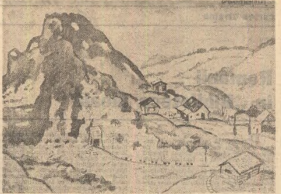
Eremie Profeta: „Pelași”

Salon de Primăvară puteau rămîne în atelierelor celor ce le-au furnizat, după cum alte lucrări, care și-au găsit locul