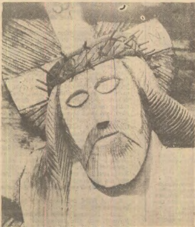
Isus pe cruce. Sculptură în lemn păstrată la biserică din Cuhurești (Bacău)