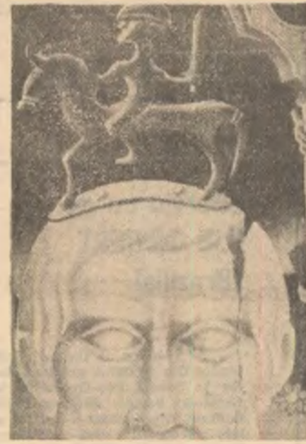
Florin Calafeteanu : „Tărm I“

Soldatul nu răspunse, dar se ridică de pe scaun, pornind spre încăperea de-alături. Mișcările lui aveau un soi de încetinelă greoaie, de parcă n-ar fi avut douăzeci de ani. Măicuța fugise înainte să deschidă larg obloanele (dar pătrun-