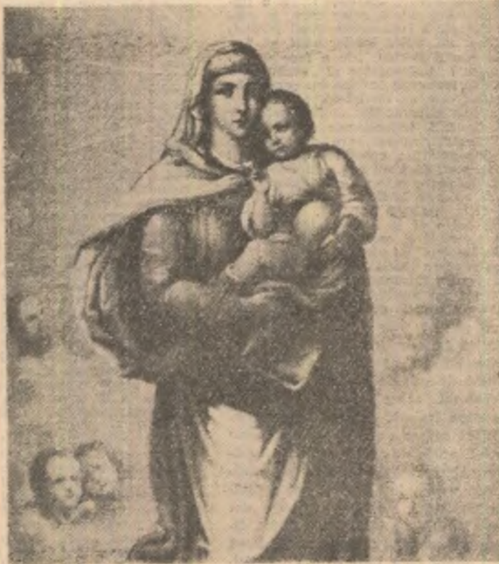
Frescă de Nicolae Grigorescu, la Mănăstirea Agapia

turor oamenilor, căci toți au păcătuit... Astfel, deci, după cum printr-o singură greșală a venit condamnarea peste toți oamenii, tot așa, printr-o singură faptă de dreptate a venit către toți oamenii o îndreptățire a vieții. Căci după cum, prin neascultarea unui singur om, cei mulți au fost făcuți păcătoși, tot așa, prin ascultarea unuia singur, cei mulți vor fi făcuți drepti”. (Romani).