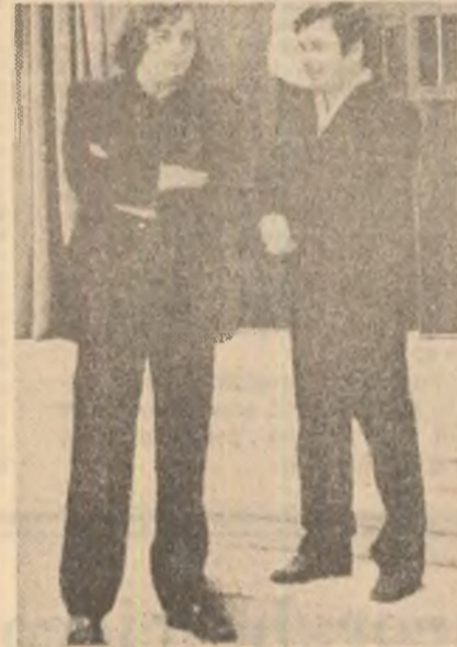
Nichita Stănescu și (cu o treaptă mai sus) Ion Băieșu