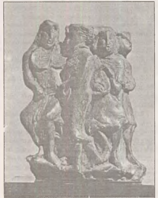
Acest număr este ilustrat cu reproduceri din lucrările sculptorului Corneliu Mihai Stănescu

Am pomenit de scriitori dispăruți; dar chiar dacă ar fi în viață nu e treaba lor să „forțeze ierarhiile”, ei trebuind doar să se înfățișeze la o nouă judecată, adică să fie aduși acolo. Iar pe aceasta nu o poate face decât disciplina abilitată cu astfel de treburi și care e doar una: critica.