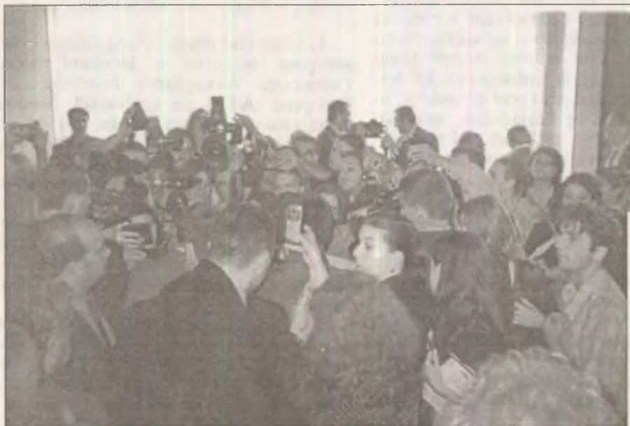
La Mangalia, cu prilejul „Zilelor și nopților de literatură”, președintele țării, Ion Iliescu, a fost asaltat de reportofoane. Să mai spună cineva că politica nu se coalizează cu arta!