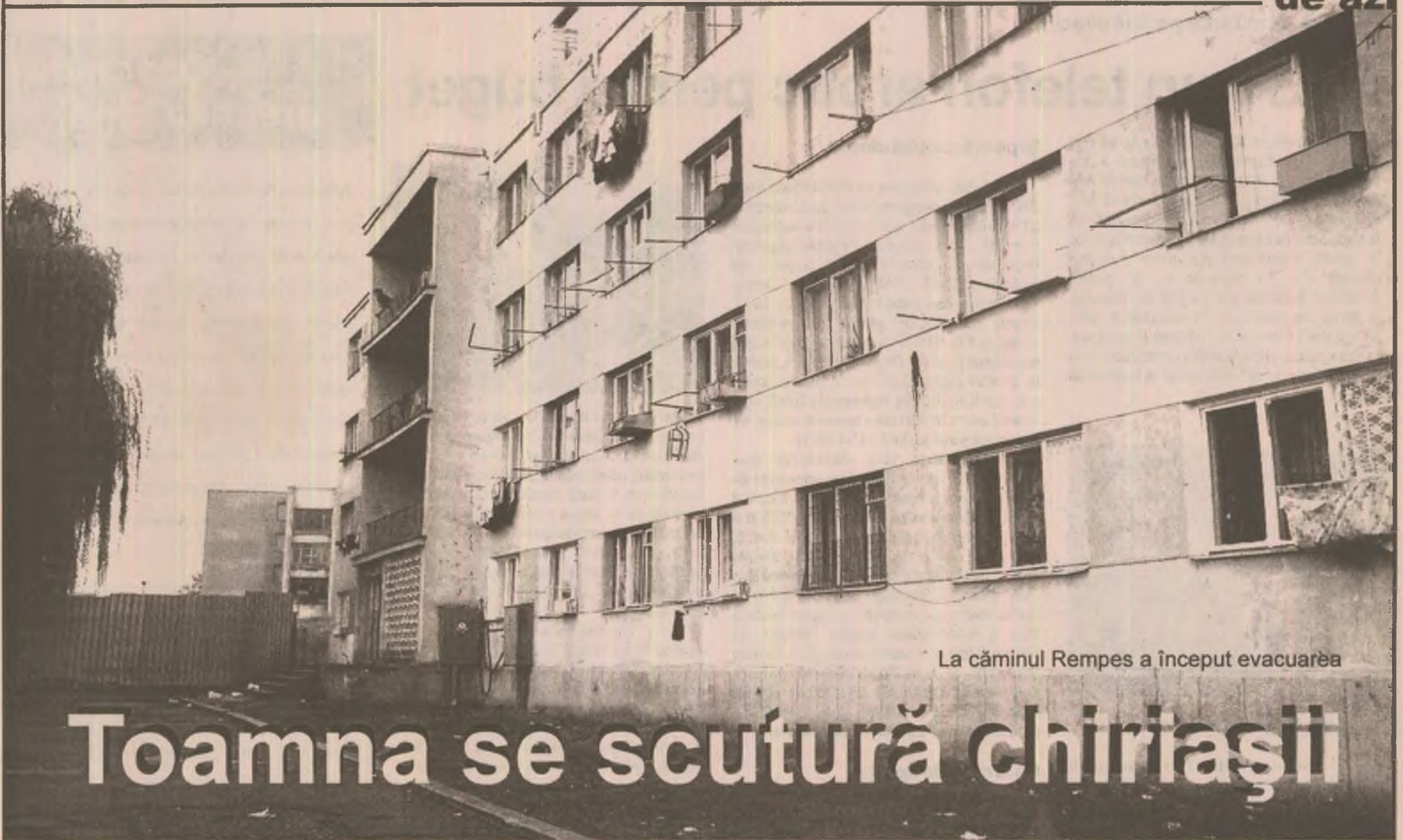
La căminul Rempes a început evacuarea