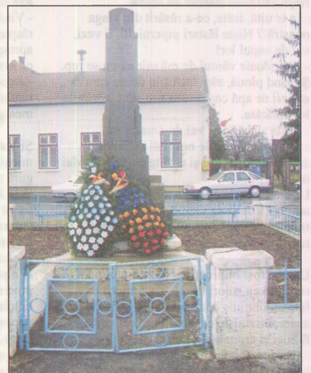
Pagină realizată de Stejărel Ionescu