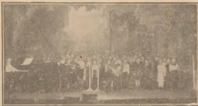
Corul și orchestra.