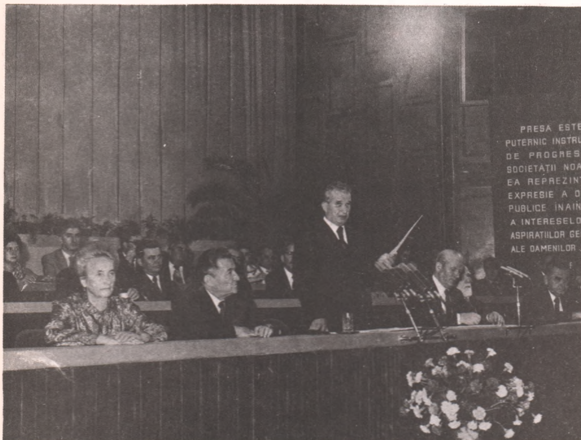
Aspecte de la Adunarea festivă consacrată celei de-a 50-a aniversări a „Scintei” și sărbătoririi Zilei presei.