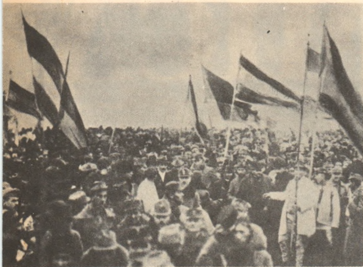
gine-simbol din timpul Marii Adunări Naționale de la Alba Iulia

împlinirea aspirațiilor și luptei de veacuri ale poporului