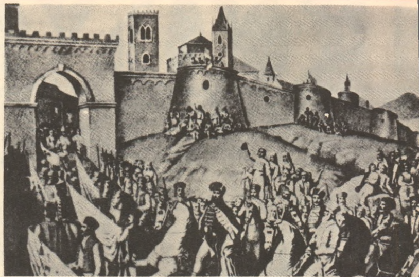
Mihai Viteazul – sub conducerea căruia s-a realizat pentru prima oară aspirația seculară a unirii românilor – intrând în Alba Iulia