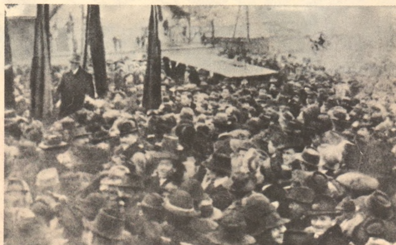
Valea Jiului, noiembrie 1918: manifestație în sprijinul Unirii Transilvaniei cu România