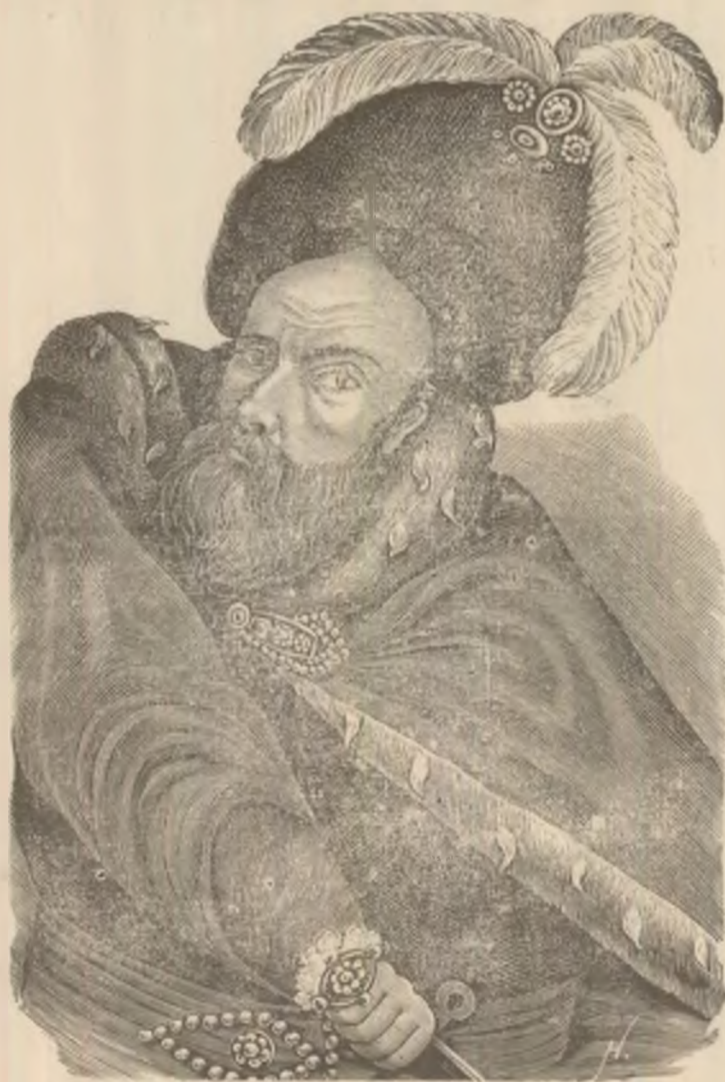
Ioan Vođa cel Cumaci.

Zoe se gândea: Cum se poate se me fi înșelat așa de tare în Silviu acesta. Îmi părea așa de eloquent, așa de plăcut mai înainte și etă-l acum sdrobindu-mi toate înșimile. Orî poate că-l vedeam numai pe el și numai ađi când îl ved fața în fața cu un om de talia generalului, il pot apreția după merit?!