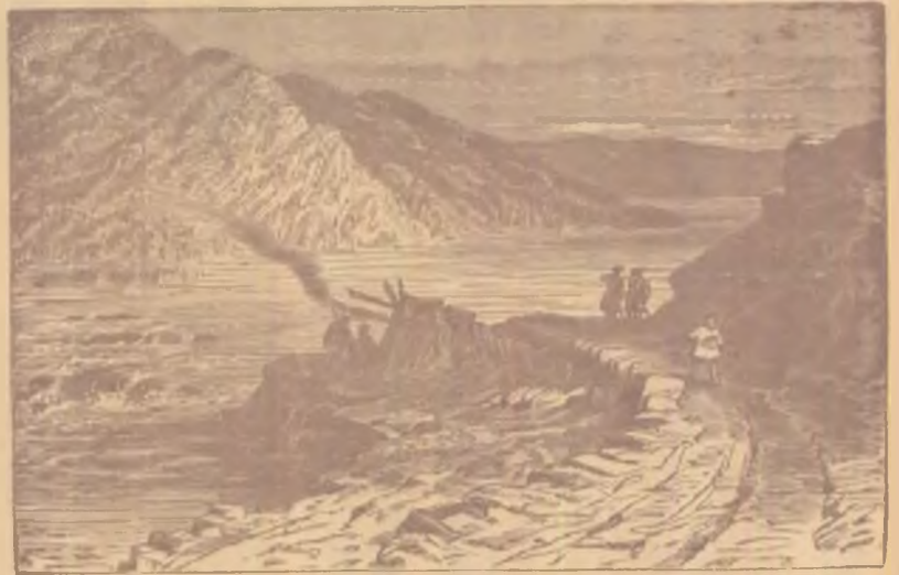
Un pas prin munte.

— Cinc  corone! —  ncepu Cloroform din nou. — Dar omul lui D-deu, -d r' n'ai de g nd se mergi la expoziția dela Paris? Sau p te vrei se fac  o c l tori  in jurul p m ntului?... Cinc  corone! Par'c  aș! fi  nrudit cu minele de aur dela Clondike! O,  eilor — și Cloroform  și ridic  m nile spre acea parte a od ii unde afar  se  ntinde cerul și erumpend in tr'un r s diabolic.