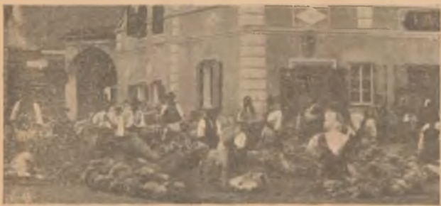
La tinsul oilor.

— Scumpă Letiție, noi ne iubim cu sinceritate, însă sora-