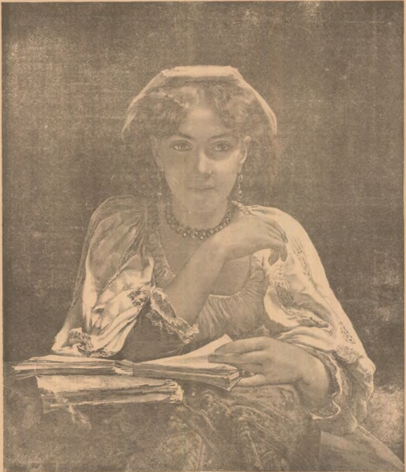
Óre ce gândește ea?