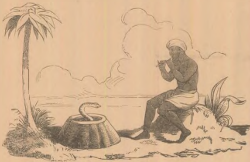
Înlîndătorul de șerpi.

Din depărtare se auzea doinele duioșe, cîntate de ciobani, cari mîrgînd în urma turmelor, umpleu vîzduhul cu acorduri duioșe.