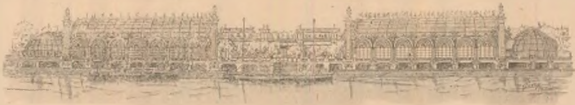
Palatul Horticulturii la Expoziția din Paris.