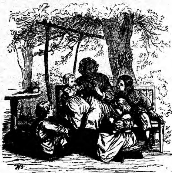
Bunica și nepoții.

— Îți mulțumesc, bărbățele. Apoi urmează un