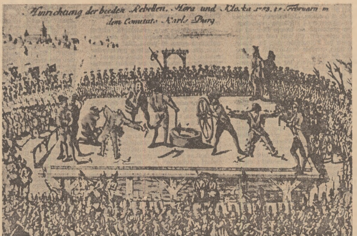
Supliciuul lui Horia și Cloșca (după o stampă de epocă)

(Din volumul în pregătire Litani pentru Horia)