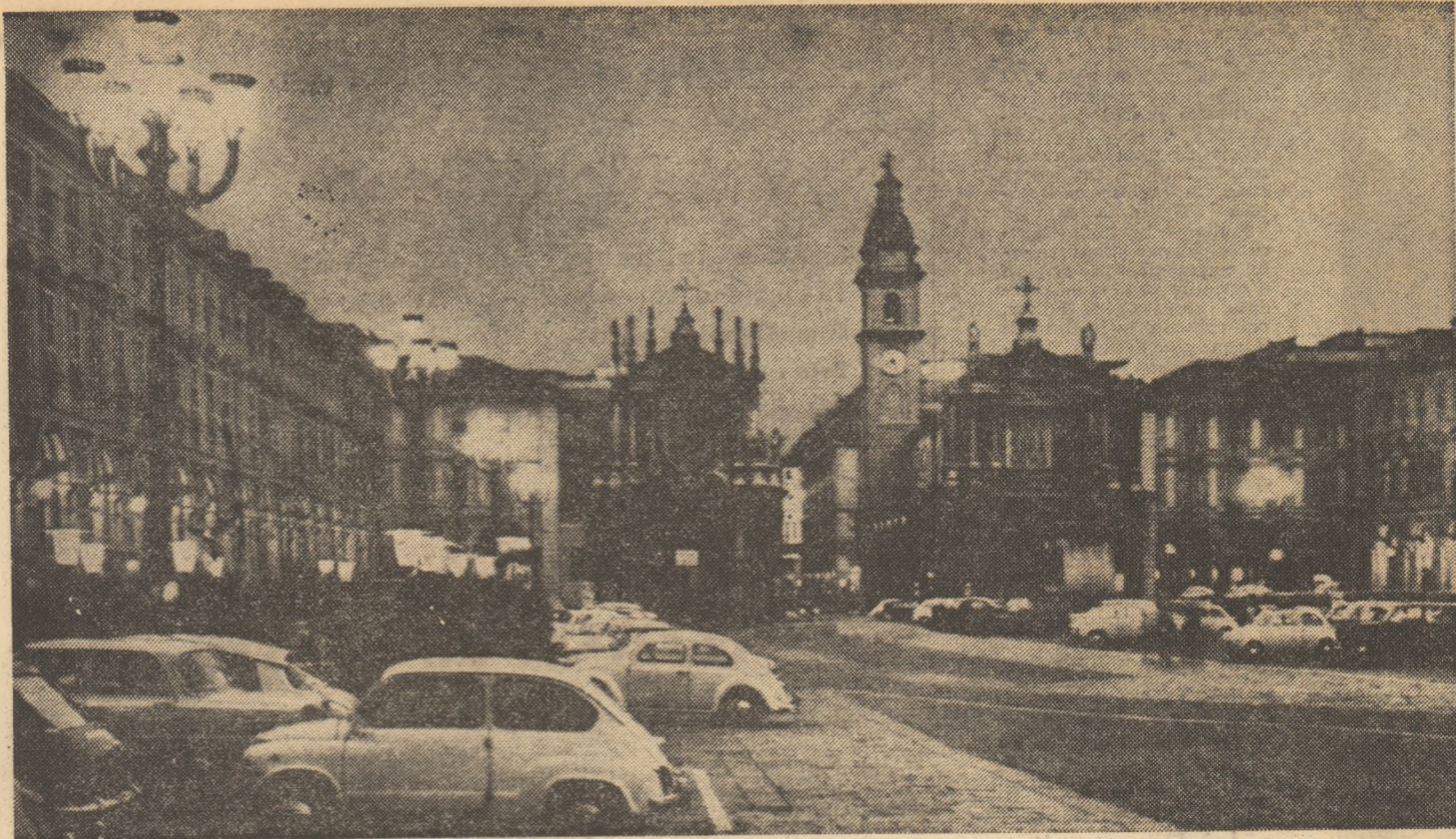
Torino — Piazza S. Carlo