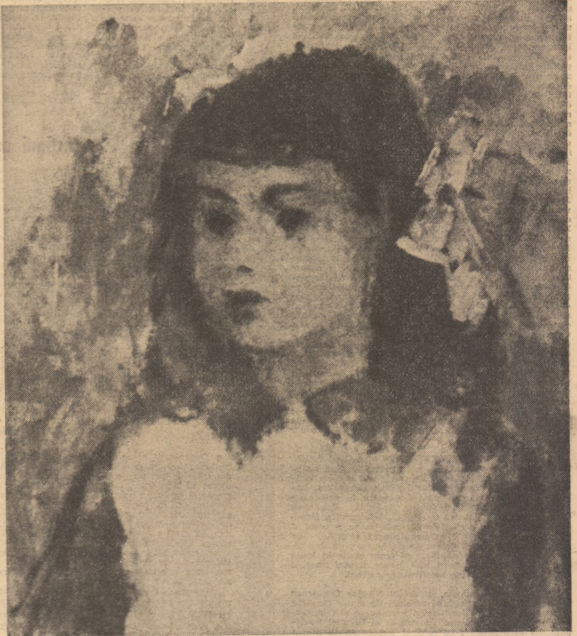
ION MUSCLEANU : Portret (Din expoziția permanentă cu vinzare deschisă la Galerile „Orizont”. Lucrările sînt donate de artiști plastici din Capitală, sumele realizate fiind destinate „Contului solidarității și omeniei 1977”)

Este expresia geniului revoluționar, a unei monumentale viziuni de călător al viitorului construit sub auspiciile celei mai autentice trăiri în efervescența unui prezent a toate-creator.