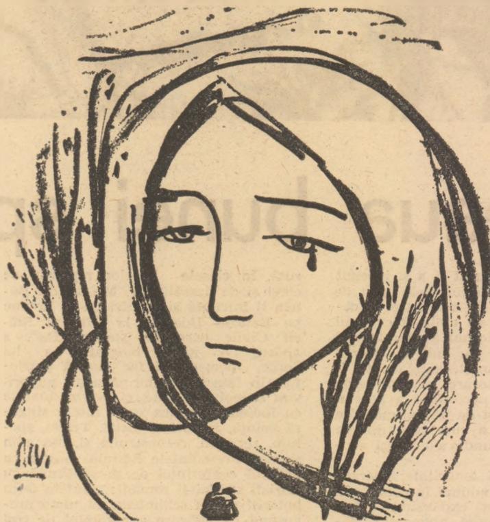
Desene de Miha Vulcănescu