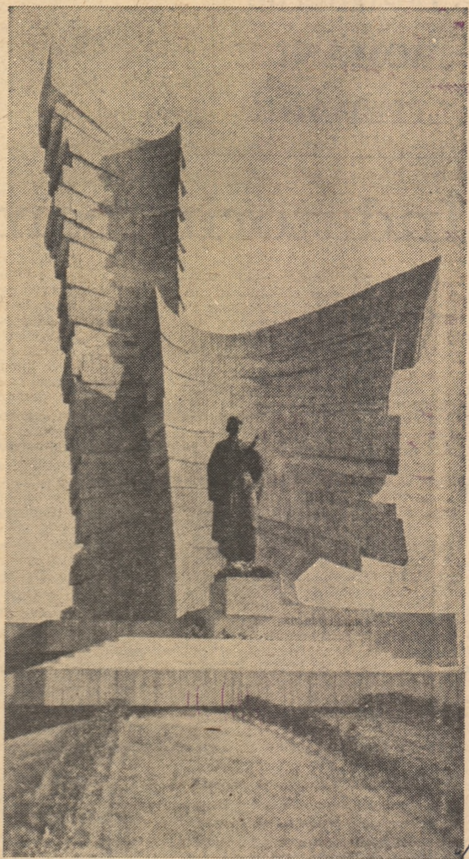
MONUMENTUL EROILOR DE LA PĂULIȘ (sculptori Emil Vitroel și Ionel Munteanu, arhitect Cristea Miloș)