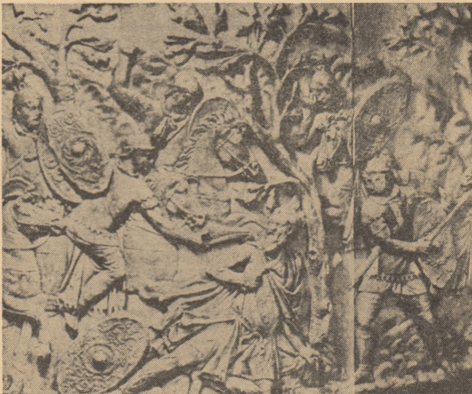
DECEBAL, relief de pe Columna Traiană

Mi-am muncit pămîntul cu sirg pină mi-au dat holdele-n pirg din primăvară pină în toamnă am trudit întruna pe toate tarlalele pină mi-au foșnit în singe păioasele