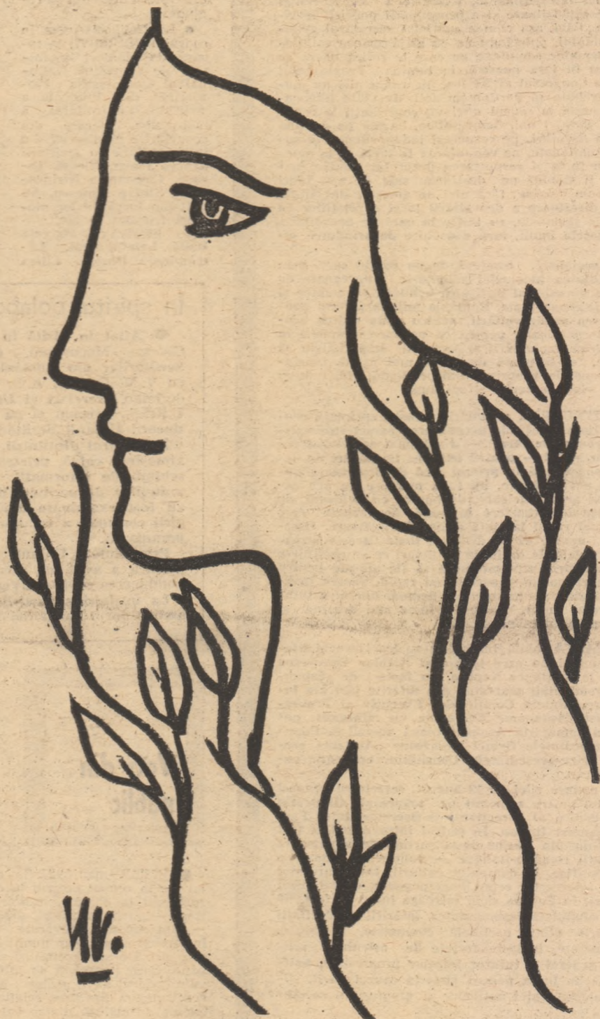
Desen de MIHU VULCĂNESCU