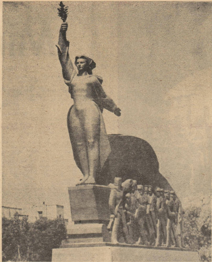
VICTORIA, sculptură de Boris Caragea

cum cad de pe-acele argamente de exoduri ni de poduri legende.