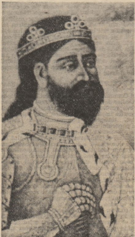
BASARAB I — pictură de CONSTANTIN PETRACHE

De aceea istoria trebuie să fie astăzi mai