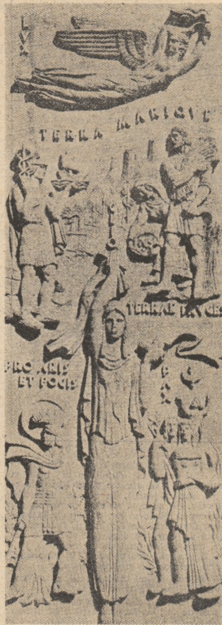
MAC CONSTANTINESCU: Clio (basorelief)

Dacă în multe opere, faptul istoric a fost tratat în manieră ilustrativă, există în literatura noastră o perspectivă estetică mai profundă, o întuire metafizică a vechimii și originilor, care se așează firesc lângă latura vizionară a demersului artistic. Reprezentantul ilustru al acestei direcții a fost, la sfîrșitul veacului trecut, Mihai Eminescu. În proiectele și fragmentele marelui poet, ca și în scrierile finite dealte, își face loc nu doar un suflu liric nou — atunci cînd e abordată tema istorică — dar o concepție nouă. Nu evocare cronografică și nu reconstituire cu iz arhivistice vom găsi în versurile eminesciene care trebuiau să se constituie într-o epopee sau dramă daco-romană. Viziunea nu e de o solemnitate rece, distantă, simțul fibrei originare lasă imaginației o libertate de care un Alecsandri n-a beneficiat decît în parte în piesele sale despre Ovidiu și Horea. În Gemenii, Sarmis, Rugăciunea unui dac , precum și în proiectele pentru o epopee și o piesă despre Decebal, Do-