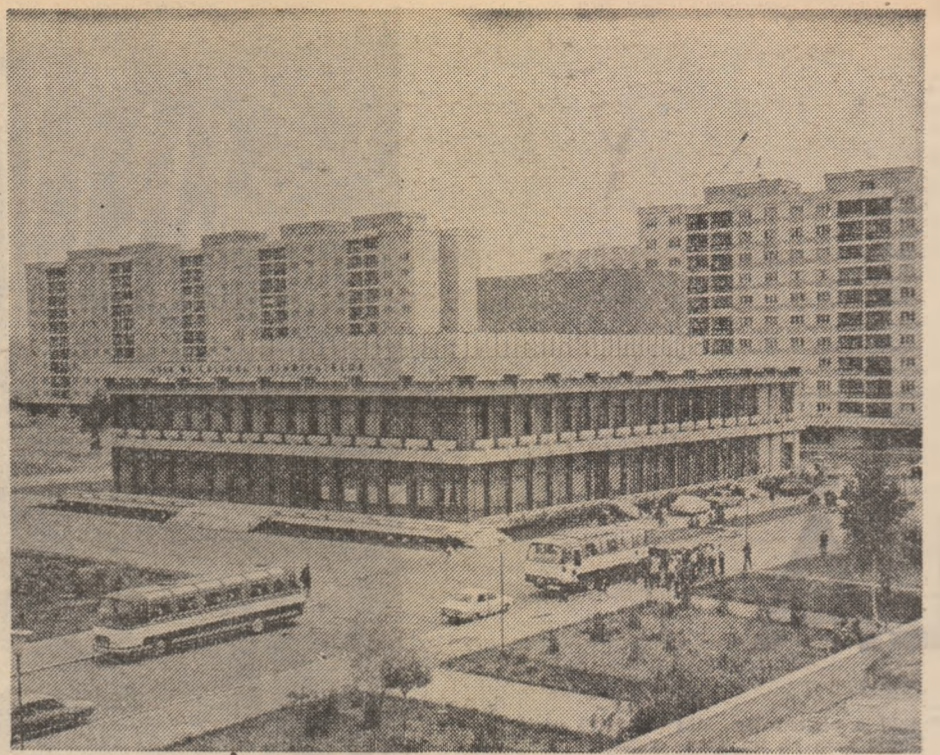
Noul centru al municipiului Gh. Gheorghiu-Dej

● PE MARILE șantiere, și Onești era unul dintre acestea, prin dimensiuni apropiat celui gălățean, lucrările pleacă de la litera a, baracamentele din stufi,