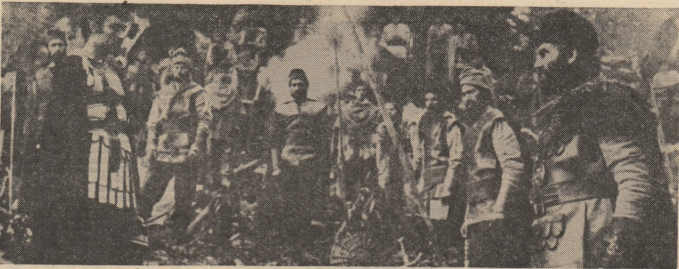
Cadru din Colonna, film inspirat de epopeea genezei poporului român