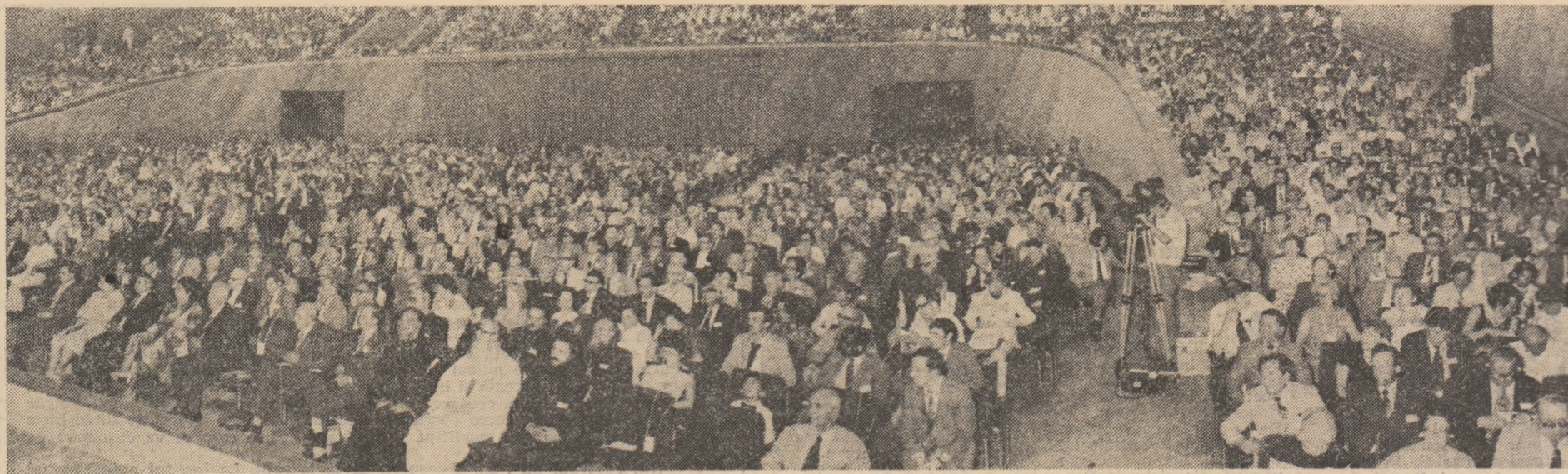
În prima zi a lucrărilor celui de al XV-lea Congres Internațional de Științe Istorice de la București. Aspect din Sala Paatului Republicii