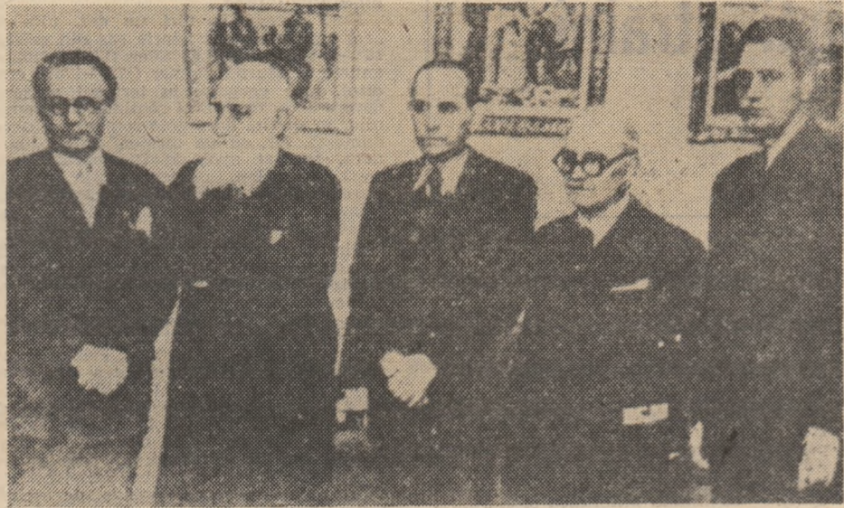
29 decembrie 1946: Gala Galaction și Tudor Arghezi sint sărbătoriți la Ministerul Artelor. In fotografie: Ștefan Tita, Gala Galaction, Ion Pas, Tudor Arghezi și Zaharia Stancu

R ELAȚIILE prietenești dintre Gala Galaction și Tudor Arghezi, 1) legate încă din anii școlărității, sint atît istorice, dacă se poate spune, cit și legendare. Cel dintîi a afirmat cîndva că s-a lăsat să repete o clasă de gimnaziu, deși o absolvise, numai și numai ca să rămînă împreună, în aceeași strînsă colegialitate. Dacă a fost așa, este un caz unic de frăție de cruce, reală sau simbolică. Mai tirziu, în anii de călugărie fără vocație, al lui Theo, alias ierodiaconul Iosif N. Theodorescu, Gala cucerit credinței, după vizita la noi a scriitorului francez Josephin Péladan, care-și zicea Săr, a putut să se înduioșeze de gestul tînărului său prieten, căruia nu-i reușise experiența de ajutor-chimist la fabrica de zahăr Chitila 2) . Era firesc, așadar, ca lepădarea rasei, de către nonconformistul, rătăcit în monahism, să-l fi mișnat adînc pe Gala, care a dat expresie acestui sentiment în paginile respective de Jurnal . Nu știm cum a putut judeca Gala împrejurarea paternității la tînărul său prieten, care l-a avut ca fiu întîi născut pe Eleazar (Eli Lotar), încă înainte de a rupe formal cu cinul. Este posibil ca mult îngăduitorul, credincios sfatului evanghelic, care interzicea credincioșilor să-și judece semenii, să-și fi reprimat dezaprobarea.