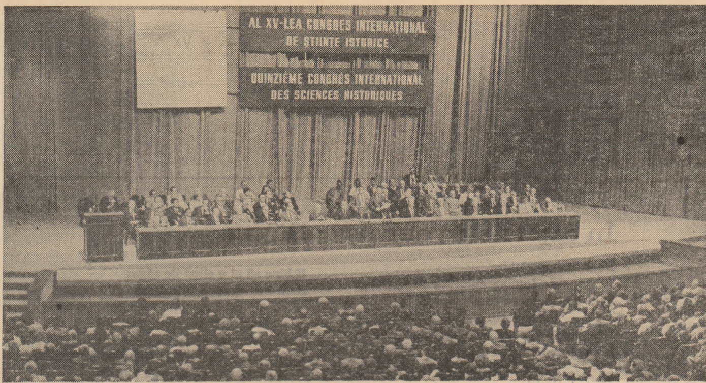
Duminică, 10 august 1980. Sala Palatului Republicii. La deschiderea lucrărilor celui de-al XV-lea Congres Internațional de Științe Istorice