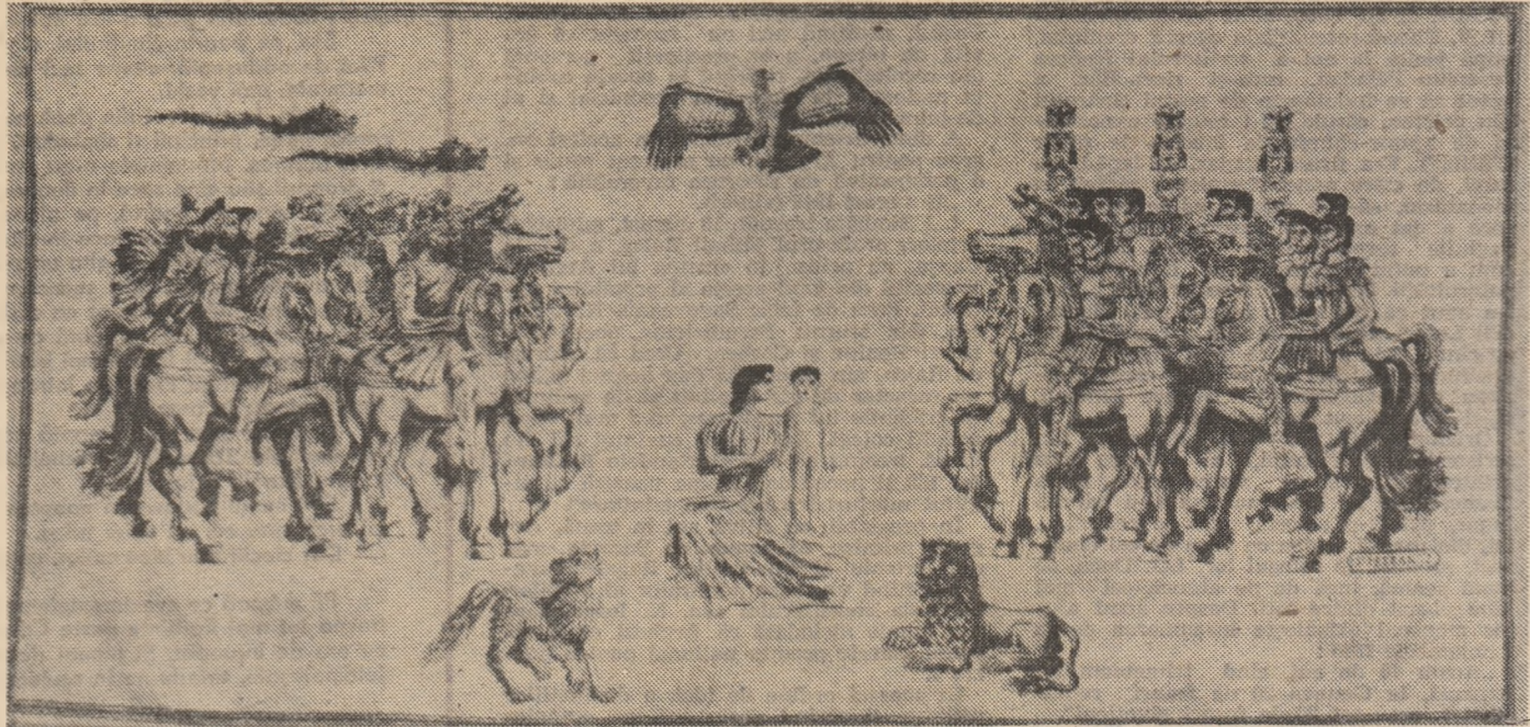
VLADIMIR ȘETRAN : Nașterea poporului român