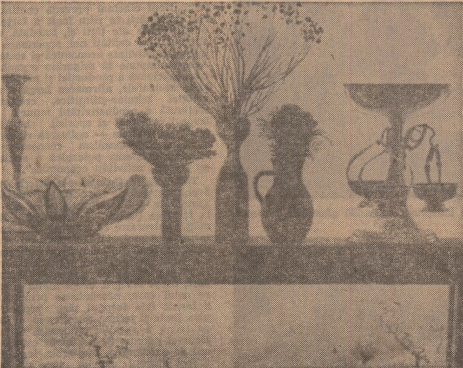
EUGEN CRĂCIUN : Fantezie de iarnă (Salonul municipal — Muzeul de artă)