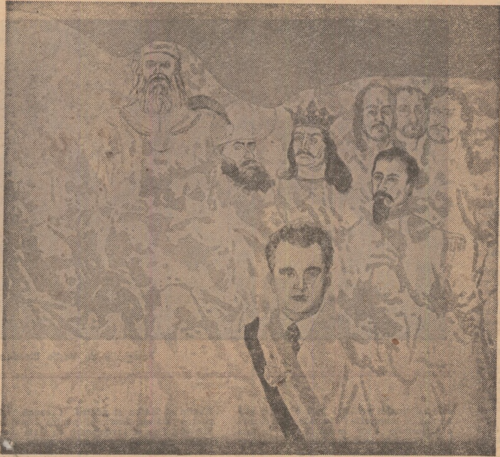
INSCRIPTII PE DRAPEL — pictură de Eugen Popa