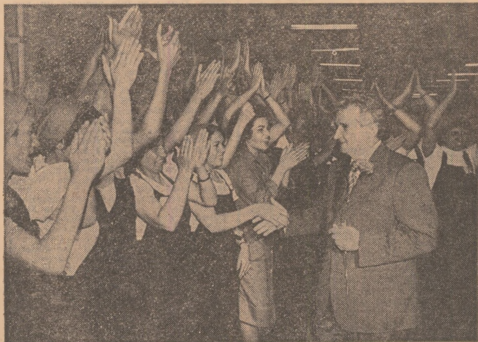
20 iunie. La întreprinderea textilă „Aurora”, București