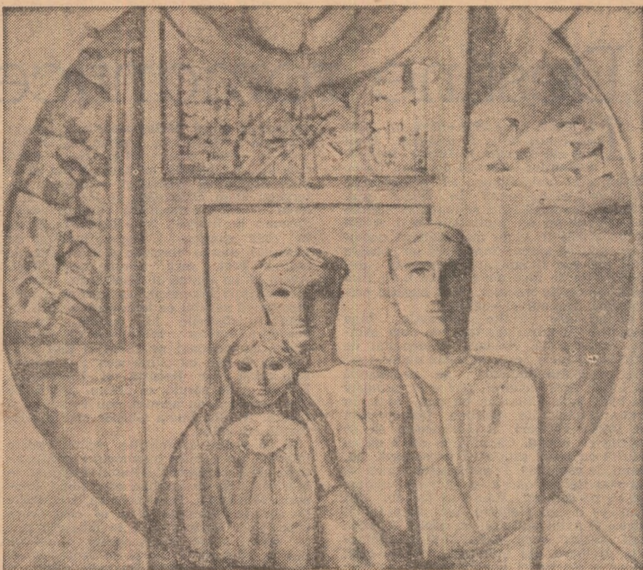
GETA MERMEZE : Pe drumul luminos al păcii