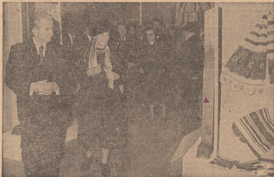
16 decembrie. Vizitând expoziția laureaților Festivalului național „Cântarea României”