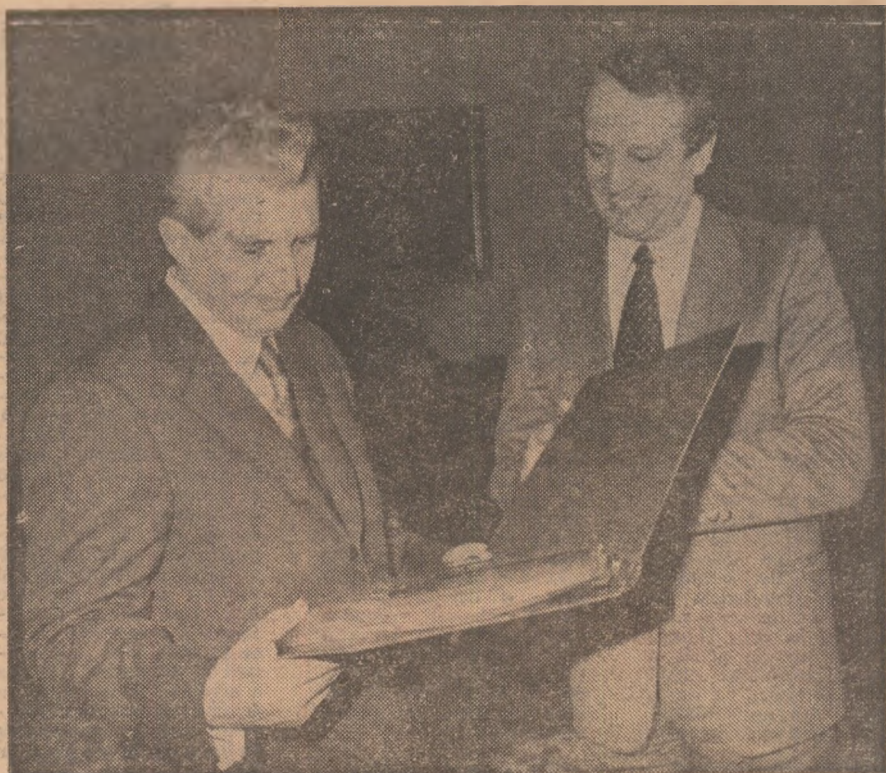
9 decembrie 1981 : Înminarea „Plachetei de aur” a Giuentei regionale Piemont

D ICȚIONARELE ne arată că, în accepția ei concretă, pacea poate fi definită drept starea relațiilor dintre state caracterizată prin absența războiului, a utilizării violenței armate. O asemenea definiție a păcii este fără îndoială expresia unei realități istorice, de vreme ce tipul de pace edificat pînă în prezent, de-a lungul istoriei omenirii, nu a depășit simpla absență a confruntării armate.