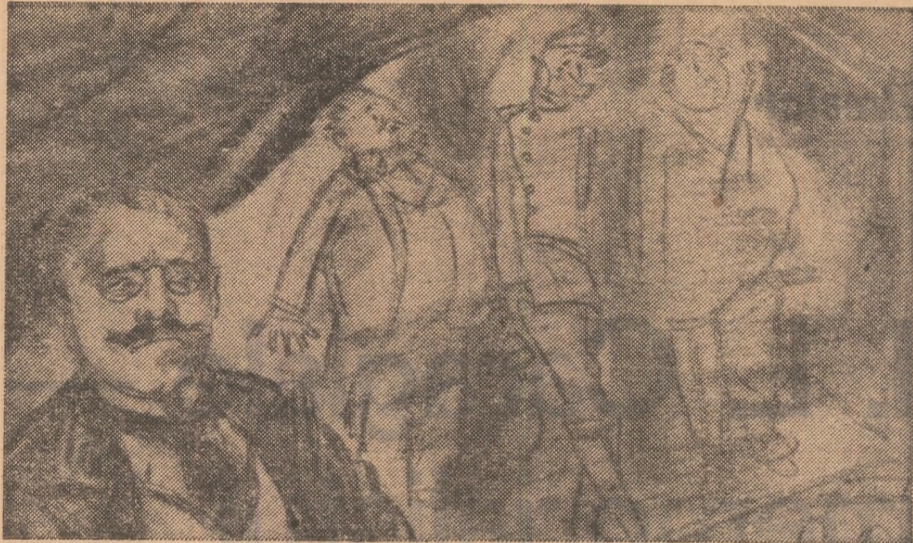
Caragiale și eroii săi — desen de A. Jiquidi

*) Titlul exact al scrierii este Scènes de la vie de bohème , iar autorul ei — Henri Murger I