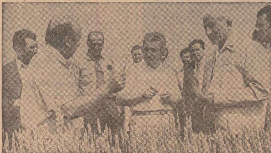
27 iunie. La complexul de la Fundulea