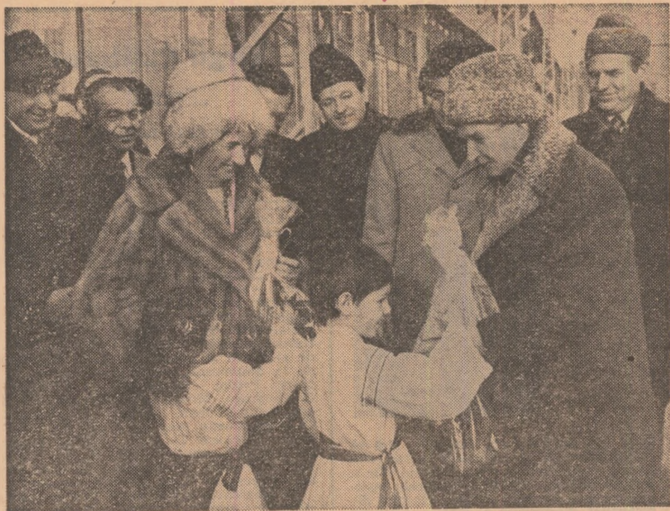
13 ianuarie. La întreprinderea mecanică din Timișoara