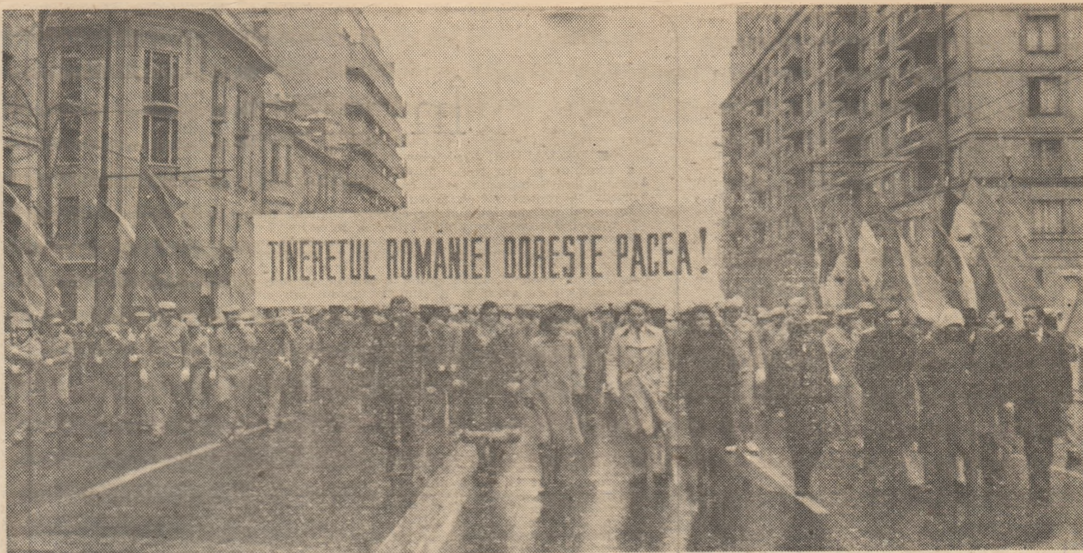
„Tineretul României dorește pacea!” Sub această lozincă s-a desfășurat, la București, în 12 noiembrie 1983, marele marș al tineretului pentru pace și dezarmare