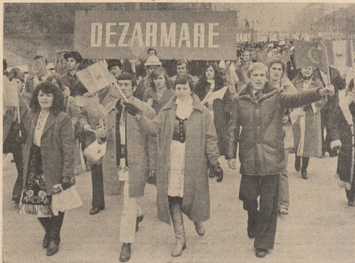
București, 12 noiembrie 1983. Marele marș al tineretului pentru pace și dezarmare

Întregul tablou al epocii pe care o numim, cum o va numi și istoria, Epoca Nicolae Ceaușescu , o confirmă. De la