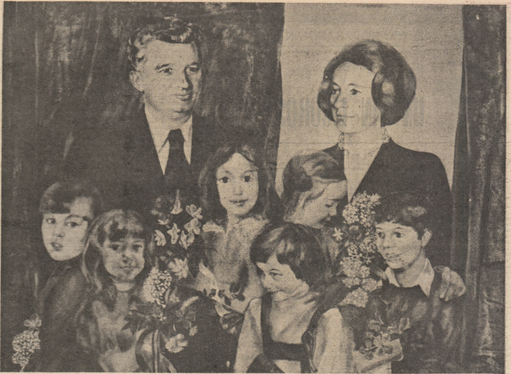
GIU - pictură de Zamfir Dumitrescu