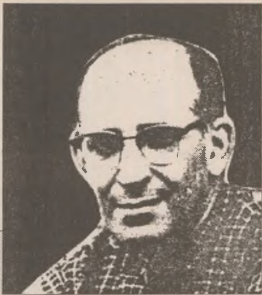
Bernard Malamud (1914-1986) face parte dintr-o categorie de scriitori americani care, în vir-

tutea deprinderilor procustiene ale istoriei literare, îi numără și pe Saul "Bellow, pe Philip Roth și pe Chaim Potok, parțial pe Isaac Bashevis-Singer. Și-a început, aproape concomitent, în deceniul al cincilea, dubla carieră de prozator și de profesor de stilistică. Născut într-o familie de imigranți, a explorat ca artist o lume în care frâna socială, umiliința și cenușiul vieții refuză alunecarea definitivă în neputință și grotesc; au loc revelații și rupturi psihologice care schimbă perspectivele, întorcându-le spre umor, bunătațe și speranță, sau măcar înno-bilează suferința. Exegeții au surprins filiații din Cehov, Joyce și Șalom Alehem; a fost categorisit și ca "un Chagall care scrie". A publicat romane (Reparatorul, Chiriașii, Viața lui William Dubin), preferințele lui mergând însă, temperamental și programatic, spre povestirile scurte (culegeri ca Negrul este culoarea mea preferată, Butoiașul vrăjit, Oameni), care i-au adus faimă internațională.