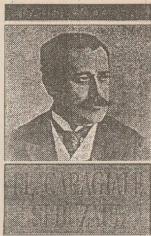
BIBLIOTECA JUDEȚEANĂ "V. VOICULESCU" BUZĂU