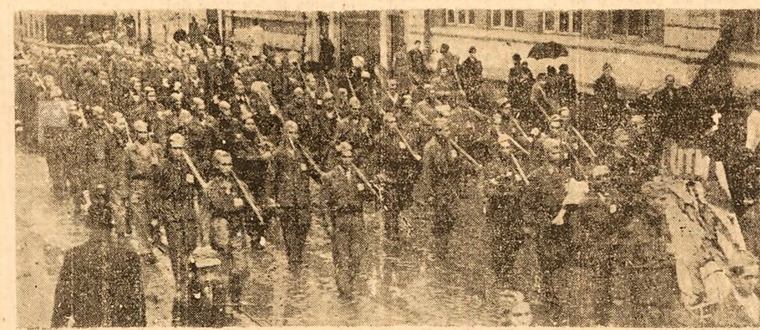
1) Perfect echipați, în șalopete și bocanci, brigadiștii (în în mână unelte) cu care au croit drum conductei. Și mai în cea: florile cu care populația Capitalei i-a primit recunoscătoare. 2) Din balconul Ministerului de Industrie și Comerț, d. dr. Petru Groza, tov. Gheorghe Gheorghiu Dej și Miron Constantinescu primesc cu bucurie pe tinerii voluntari ai reconstrucției. (Reportaj în pagina 5-a)

În numele guvernului și al C. C. al P. C. R., ei au fost salutați în Gara de Nord de tov. GH. VASILICHI, din balconul Ministerului de Industrie și Comerț, de D. Dr. PETRU GROZA, tov. GH. GHEORGHIU-DEJ, I. G. MAURER, CHIVU ȘTOICA și MIRON CONSTANTINESCU, iar din balconul Ministerului de Finanțe de tov. VASILE LUCA.