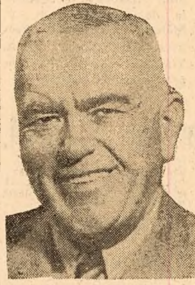
D. Dr. PETRU GROZA Președintele Consiliului de Miniștri

În urma însărcinării primite de la forurile conducătoare respective, delegații ai Frontului Plugarilor și ai Partidului Țărănesc s'au întrunit pentru a perfectă hotărârea de unificare a celor două organizații politice.