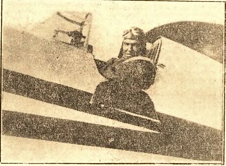
O scenă din marea realizare sovietică „VALERI CIKALOV”...