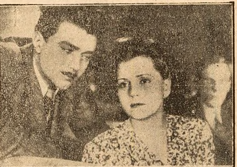
Doi din protagoniștii filmului „In numele vieții” care rulează la cinematograful „Aro” cu un deosebit succes. În clișeu una din scenele emoționante ale filmului