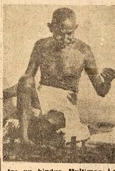
Un hindus Multimea l-a prins pe asasin și l-a predat imediat poliției.

NEW-DELHI, 30. Rador). — După cum anunță postul de radio indian, Mahatma Gandhi a fost asasinat Vineri dimineață cu patru gloanțe de revolver, de că-