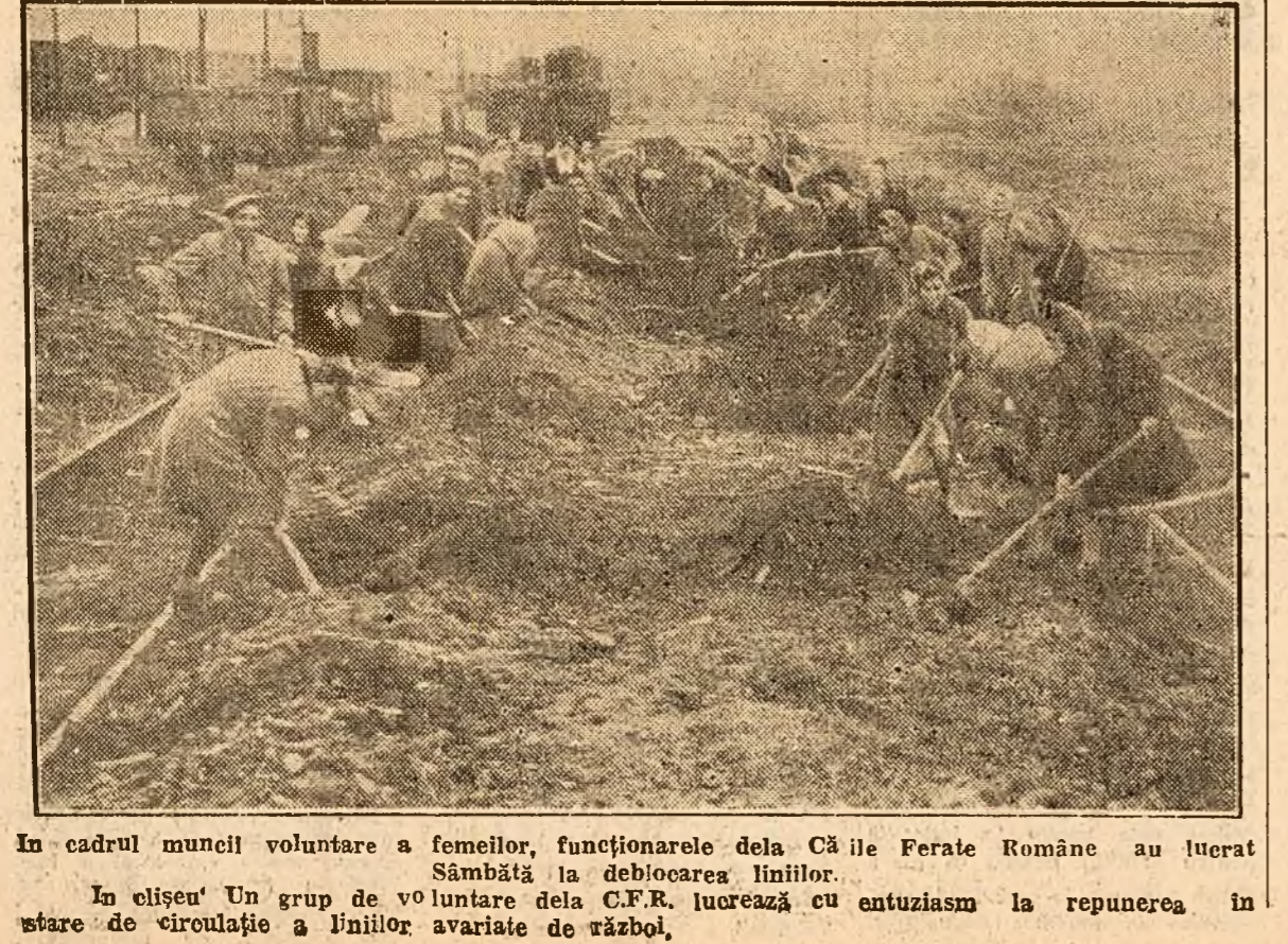
In cadrul muncii voluntare a femeilor, funcționarele dela Căile Ferate Române au lucrat Sâmbătă la deblocarea liniilor. In clișeu: Un grup de voluntare dela C.F.R. lucrează cu entuziasm la repunerea în stare de circulație a liniilor avariate de război.

p. conf. Tudor Ojaru (Continuare în pag. III, col. 5-6) Comitetul Național al Copiului are în programul lui de activitate, deschiderea unor centre de lapte în toate cartierele Capitalei. In clișeu: prima zi de distribuție a laptelui la centrul nou înființat în cartierul Cioplea.