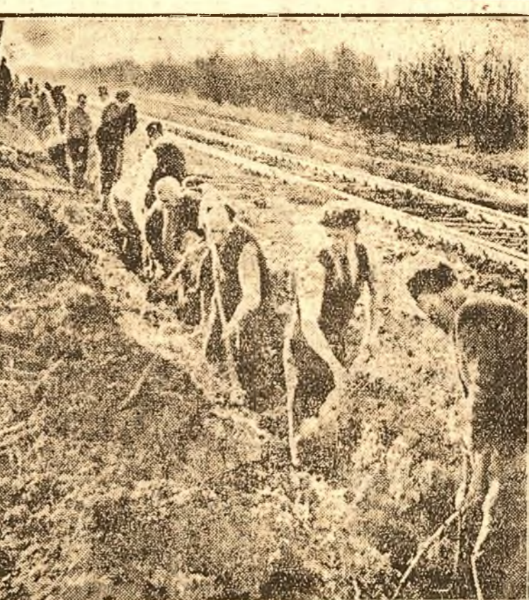
Echipe de voluntari ale Sindicatului C. F. R., femei, bărbați și tineri, la muncă voluntară

„Toți boerii sunt așa... Cât au puterea în mână, tae și spânzură. Dar într'altfel se poartă când le fuge pământul de sub picioare: își schimbă graiul, uneori și portul, au vorba dulce, mieroasă. Dar sufletul tot călărit îl rămâne, fier și venin... Li cunoaștem noi... De le-ar veni iar timpul, apoi atunci ai vedea. Nu-mai că nu-i pe vrerea lor”.