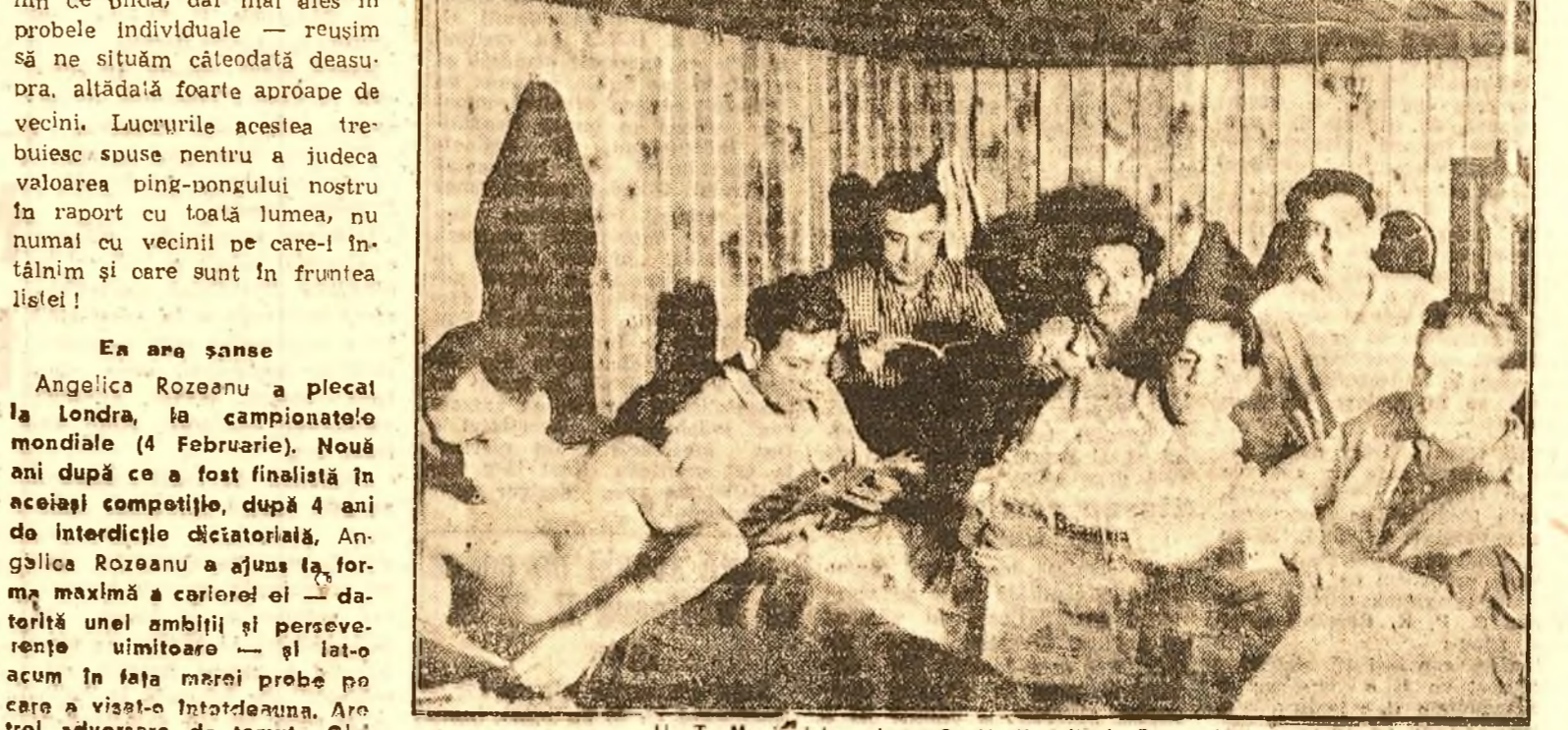
U. T. M.-iști la cabana O. N. T., citind „Scânteia“

En apa șanse Angelica Rozeanu a plecat la Londra, la campionatul mondial (4 Februarie). Nouă ani după ce a fost finalistă în aceiași competiție, după 4 ani de interdicție dicționarială, Angelica Rozeanu a ajuns la forma maximă a carierei ei — datorită unei ambiții și perseverențe uimitoare — și lăto-acum în fața mării probe pe care a vădit-o întotdeauna. Are trei adversare de tonut: Gizi