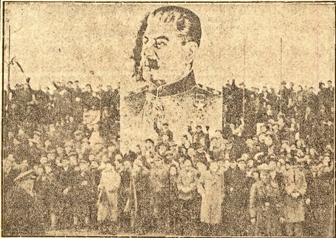
Figura măreață a Generalissimului Stalin, se află — simbolic — printre oamenii cuprinși de entuziasm

SUTE DE MII de CETĂȚENI AUSALUTAT CU UN IMENS ENTUZIASM PE ÎNTREGUL PARCURS DELA FRONTIERA