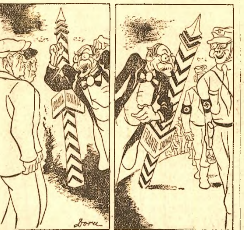
1936 1948 Leon Blum: Suntem „neinter- venționisti”. Nu puteți trece în Spania.

D. Leon Blum a fost de acord cu deschiderea frontierei franco-spaniole