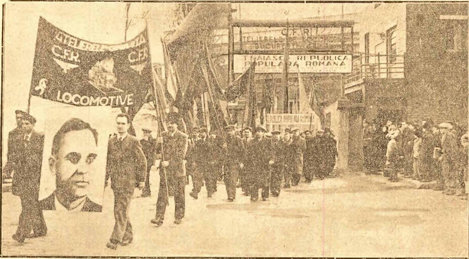
După 15 ani dela luptele din Februarie 1933, muncitorii ceferiști merg înaintea sub steagurile Republicii Populare Române urmându-l pe tov. Gheorghe Gheorghiu-Dej, cu același entuziasm, cu aceeași dragoste și încredere pe care le-au avut sub gloanțele monarhiei burghezo-moșierești.