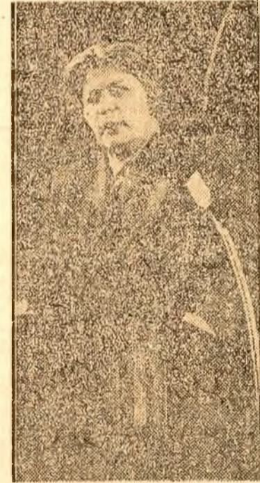
Tov. Ana Pauker vorbind

„Când guvernul manist a introdus impozitul salariilor curbule de sacrificiu, tov. Gheorghiu se afla în fruntea comuniștilor care mobilizau și organizau pe muncitorii din Galați în lupta împotriva înrăutățirii nivelului lor de viață, împotriva exploatarea, jafului, mizeriei, impozitului scaderii de salarii. I se încredințază conducerea organizației de Partid din Galați. Incepe să organizeze întruniri zburătoare, în port, în fabrică, dimineața sau seara; organizează grupe de muncitori care să prelucereze manifestele și instrucțiunile Partidului; organizează acțiuni de masă etc. Atenția lui principală se îndreaptă spre încheierea unității muncitorilor în întreprinderi. Pe baza instrucțiunilor primite din partea conducerii centrale a Partidului, începe organizarea de celule de partid, pe fabrici, în port,