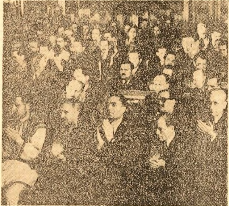
Deputații aplaudă cuvintele ministrului de Externe