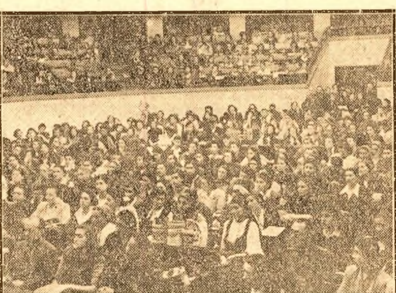
Un aspect din sala Conferinței

A sosit însfârșit ziua mult așteptată, ziua Conferinței pe țara a Uniunii Femeilor Democratice din România. Au venit din toată țara nu numai delegate, ci și sute și sute de activiste. Aula mare a Facultății de Drept geme de lume. Fețele strălucesc de bucurie, sala e minunat împodobită, lozinci înfăcșurate se aercesc, totul respiră un aer de mare sărbătoare. Sunt acolo în bănci sâtenice în portul lor minunat, care stau cu atenția încordată și iau note de cele ce se vorbește. Sunt muncitoare, intelectuale, gospodine. Au ținut să asiste la deschiderea festivă și reprezentanți de seamă ai vieții politice, ai armatei, ai autorităților, reprezentanți ai artei și culturii. În fundul sălii se ridică o femeie și cu glas puternic strigă lozinci de salut adresate Conferinței Ochii tuturor se îndreaptă cu emoție spre intrare și în clipa în care au apărut membrii Guvernului, întâi președintele Consiliului Dr. Petru Groza, apoi tovarășa Ana Pauker, ministrul de Externe, ovațiile nu se mai opresc. A. n. a. scandează întreaga sală.